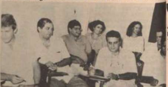
O curso faz parte de um programa de aperfeiçoamento pedagógico de professores recém-admitidos.