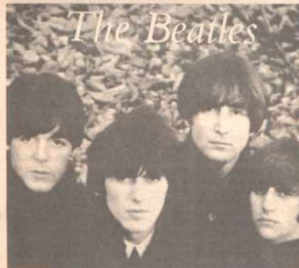
Paul, George, Lennon e Ringo: a marca de uma época.

A trajetória dos Beatles e a sua importância para a música popular contemporânea poderão ser avaliadas na mostra fotográfica montada no mezanino do Centro de Vivência, promovida pela Divisão de Assuntos Culturais da UFV, com o apoio do Conselho Britânico do Rio de Janeiro. A exposição é intitulada "Jornada Histórica dos Beatles" e estará aberta ao público até o dia 10 de maio.