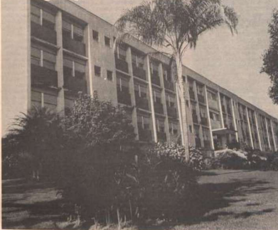
Vista do prédio do Alojamento Feminino da UFV.