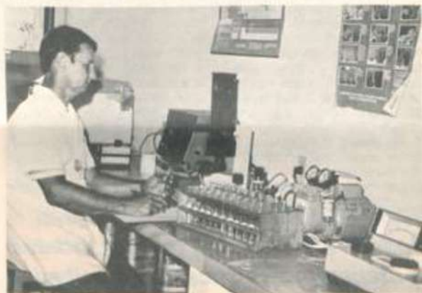
Análises laboratoriais são realizadas na UFV.