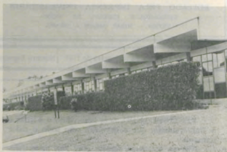
Pavilhão de Aulas

Traga lápis n.º 2 ou 2B, caneta esferográfica, borracha, cédula de identidade, comprovante de inscrição e nada mais.