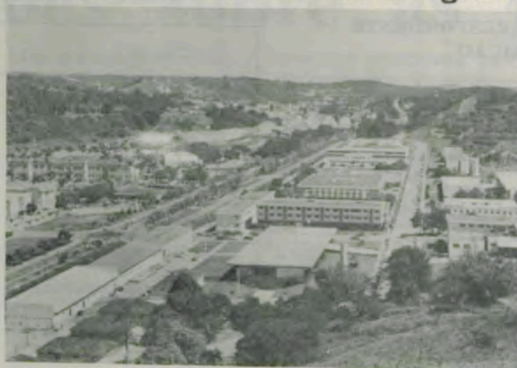
Vista parcial do «campus» universitário.

O Laboratório de Desenvolvimento Humano, criado em 1979, reflete bem a preocupação da UFV na formação humana, atendendo a crianças de diferentes níveis sócio-econômicos, na