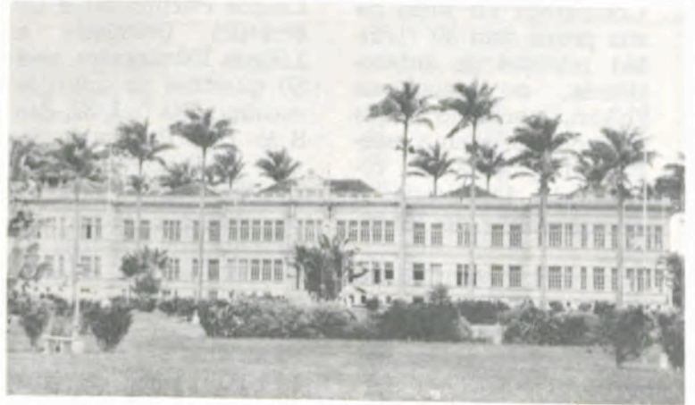
O Edifício Arthur da Silva Bernardes, um dos símbolos da UFV.

Ano 19 Sexta-feira, 02 de janeiro de 1987. Número Especial.