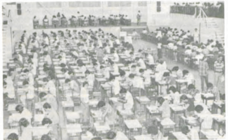
Uma das provas, no ano passado.