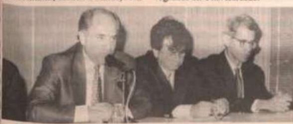
Os novos diretores de centro.

Os três novos diretores dos Centros de Ciências da Instituição foram eleitos pela comunidade universitária pertencente a cada uma das áreas, sendo o resultado final referendado por uma Comissão Eleitoral Especial, em processo coordenado pela Secretaria de Órgãos Colegiados da Universidade.