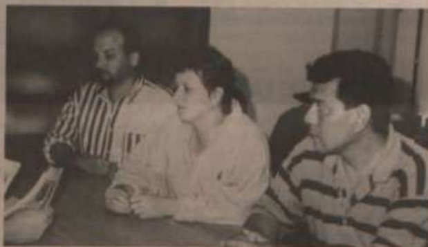
Os técnicos nicaraguenses na Divisão de Extensão do CEE.