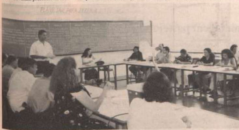
Componentes da mesa-redonda.

de árvores que apresentam riscos (23), desobstrução de redes de água e esgotos (15), escapamento de gases em geral (12), prevenção contra incêndios em acidentes e espetáculos (3), palestra sobre prevenção e combate a incêndios (2), recarregamento de extintores de incêndio (91), retirada de animais e objetos submersos ou soterrados (5), retirada de caixa de abelhas e marimbondos (17), salvamento ou retirada de pessoas em acidentes (2), serviço de salva-vidas nas represas e piscinas (10), visita de inspeção nas repartições e depósitos de risco (14) e outras atividades (57).