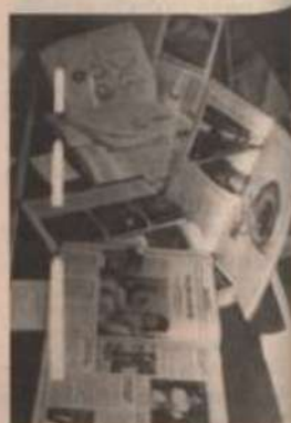
Algumas obras danificadas.

tribuem para a degradação de acervos, como iluminação, temperatura, umidade, ataque de fungos e insetos, dentre outros. Sendo, para isso, soluções imediatas, como a escolha de local para a biblioteca, espaçamento entre estantes e alguns cuidados elementares. Porém, a diretora adianta que o pior fator vem da ação do homem, começando pela falta de cuidados no manuseio dos livros e o arrancamento de suas páginas, que, em muitas vezes, torna a obra irrecuperável.