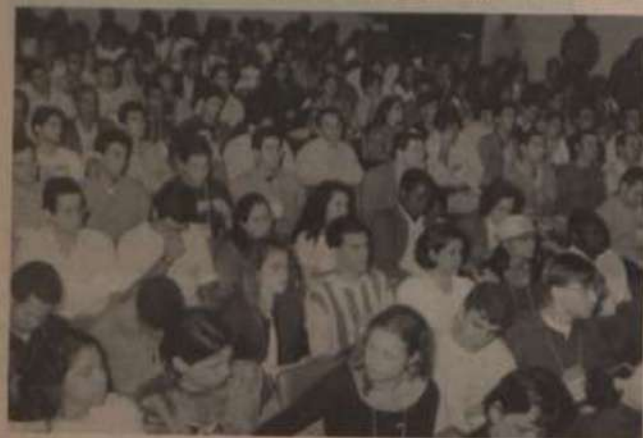
Parte do público presente ao Seminário.