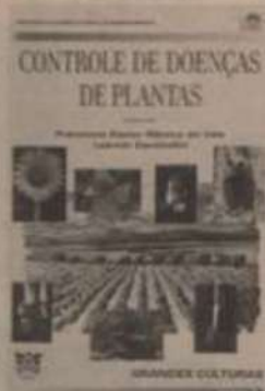
Fot. Simile da capa do livro.

A obra, com 1.132 páginas, tem apresentação do Ministro da Agricultura e do Abastecimento, Arlindo Porto, e colaboração de 54 especialistas das mais renomadas empresas e instituições nacionais. Trata-se de uma obra completa e um importante referencial para estudantes, pesquisadores e professores que queiram aprofundar seus conhecimentos a respeito do controle das principais doenças que afetam as culturas mais significativas para o País.