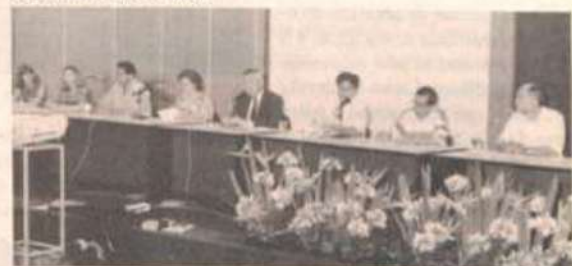
Aspecto da abertura do evento.