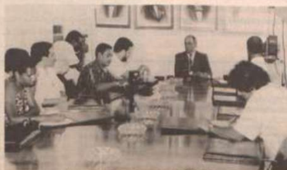
Flagrante da entrevista coletiva na Sala de Reuniões da Reitoria.

Apesar da luta e das dificuldades enfrentadas pelas universidades federais quanto a questões como a falta de recursos, de pessoal e, num futuro mais próximo, a Autonomia Universitária, o reitor da UFV informou que a