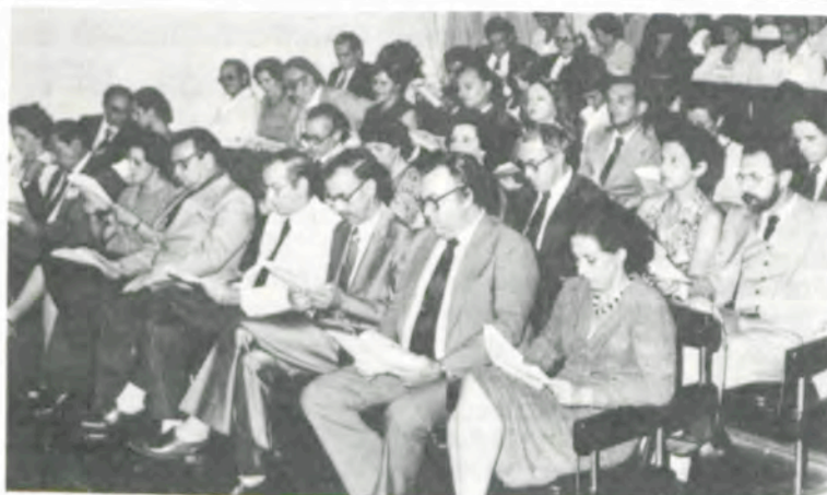
Ex-alunos que completaram seu Jubileu de Prata e familiares.