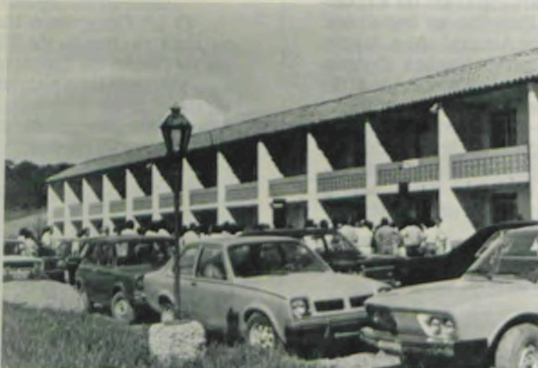
Edifício Marquês de Pombal, sede da Agência da Previdência Social em Viçosa.

A inauguração desta agência é mais uma resposta do Senhor Ministro da Previdência Social, na sua política agressiva de atender o homem, a política de Assistência Social, em todos os sentidos: seus benefícios, na