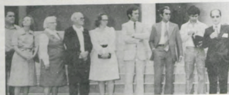
O prédio de Laticínios passou a denominar-se Ed. Beck Andersen.