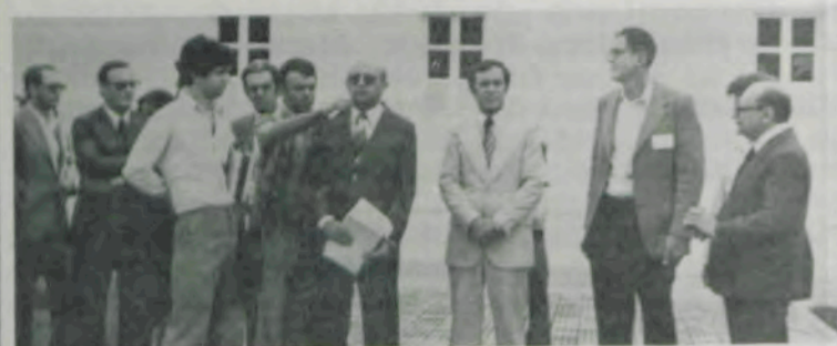
Nesta solenidade, o prédio da Reitoria da UFV passou a denominar-se Ed. P. H. Rolfs.