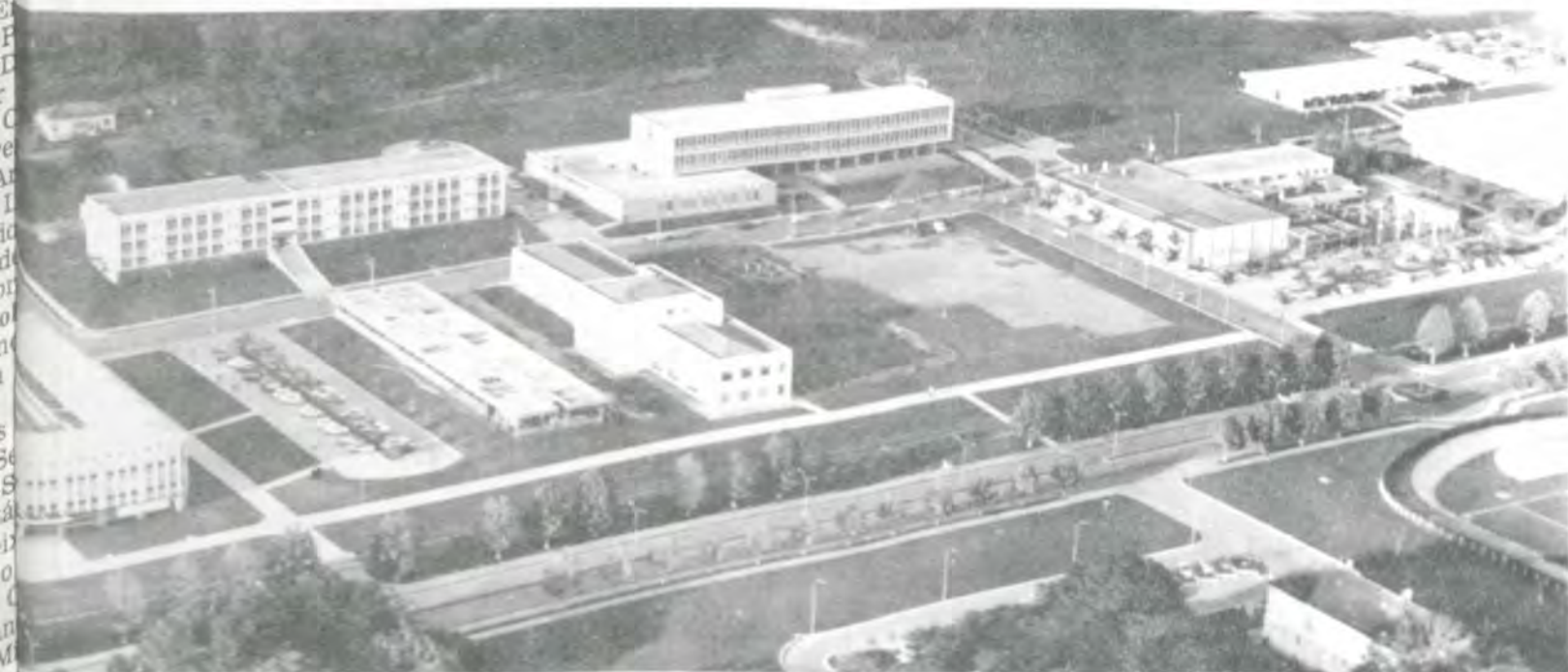
Outra vista parcial do "campus" da UFV.