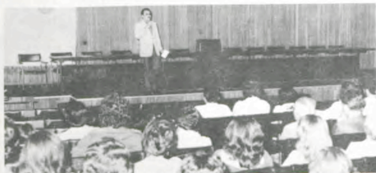
A aula da saudade.

Após instalada a mesa que dirigiu a sessão solene, foi executado o Hino Nacional, seguindo-se a declaração de presença da maioria dos membros da Coordenação de Ensino, Pesquisa e Extensão e dos Conselhos de Graduação e Pós-Graduação da UFV. Dado o assentimento para a colação de grau, teve início a cerimônia de entrega de diplomas aos novos engenheiros-agrônomos, engenheiros florestais, zootecnistas, licenciadas em Economia Doméstica, licenciadas em Ciências Biológicas, bacharéis em Matemática, licenciados em Química, licenciados em Pedagogia e de títulos aos pós-graduados.