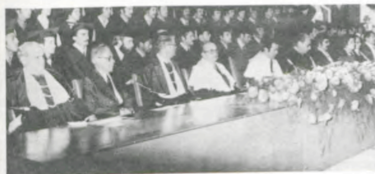
A mesa que dirigiu a sessão de colação de grau.