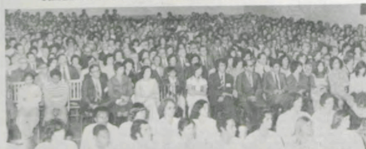
Ex-alunos e convidados lotaram o Ginásio de Esportes, na sessão solene do dia 10 de dezembro último.