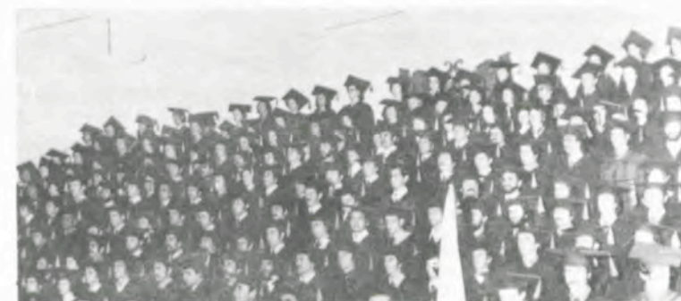
Os formandos de 1976 da UFV.