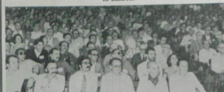
Os ex-alunos prestigiaram as reuniões plenárias da Associação de Ex-Alunos da UFV.