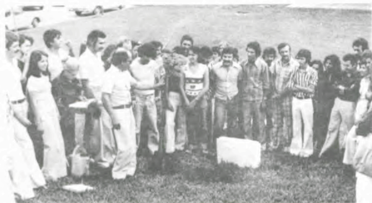
O plantio da árvore da turma de formandos.