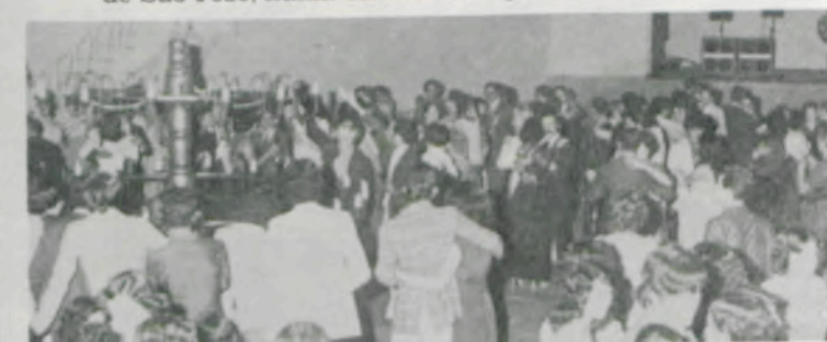
O Baile do Ex-Aluno, no Ginásio de Esportes, ponto alto das comemorações dos três dias de confraternização.