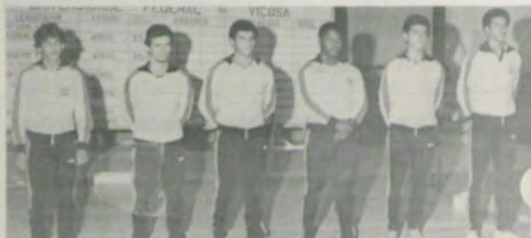
Os atletas da seletiva.