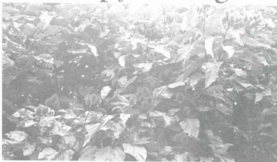
O urucum representa grande potencial para a indústria de alimentos.

O professor Stringheta disse ainda que, na área de cosmetologia, o urucum pode ser aplicado em bronzeamentos, proporcionando um bronzeamento mais bonito. Mais recentemente, affiançou o professor, indústrias americanas vêm utilizando o urucum em produtos destinados à fabricação de maquiagem e cremes, valendo lem-