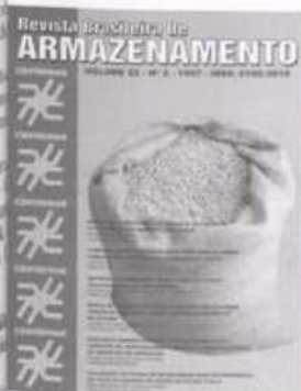
Fac-símile da capa da revista.

O Centro Nacional de Treinamento em Armazenagem (Centreinar), sediado no campus da Universidade Federal de Viçosa, em convênio com a Fundação Arthur Bernardes (Funarbe), publicou no mês de maio o nº 2 - volume 22 da Revista Brasileira de Armazenamento.