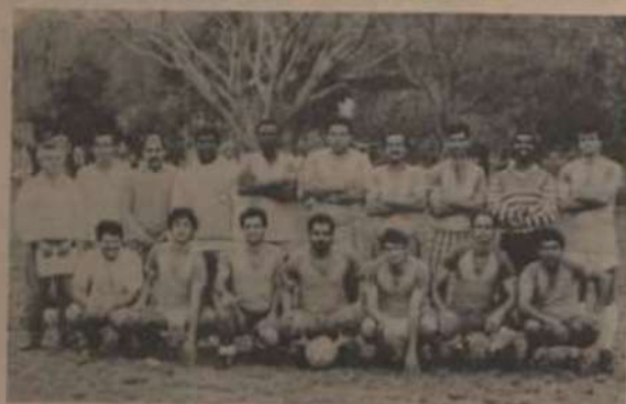
Equipe da Imprensa.