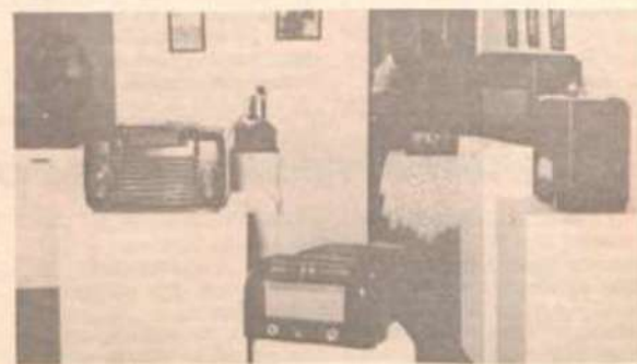
A exposição mostra antigos aparelhos de rádio, atraindo a curiosidade de todos.

A Associação "Duarte Tufuri" é uma entidade que objetiva desenvolver trabalhos de cunho assistencial e cultural no município e na região, além de difundir as culturas brasileiras e italianas, ao mesmo tempo em que resgata a memória da cidade no que se refere aos seus primeiros habitantes italianos, que concorreram para a formação da nossa cultura e etnia.