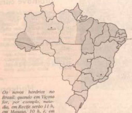
Os novos horários no Brasil, quando em Viçosa for, por exemplo, meia-dia, em Recife serão 11 h, em Manaus, 10 h, e, em Rio Branco, 9 h.

O horário de verão estará em vigor até o dia 31 de janeiro. Com isso o País estará economizando cerca de 1,7 bilhão de quilowatt-hora de energia elétrica, equivalente ao consumo do Distrito Federal durante um ano.