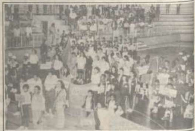
Atletas das delegações participantes.

A Universidade Federal de Viçosa sediou, entre os dias sete e 10 deste mês, a Olimpíada Estadual das APAEs e Entidades Afins de Minas Gerais.