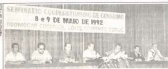
A abertura do evento no auditório do DER.

A COOPASUL congrega, atualmente, 5.233 associados, entre estudantes e servidores da UFV, e completa, dia 25 do corrente, segunda-feira próxima, 50 anos de fundação.