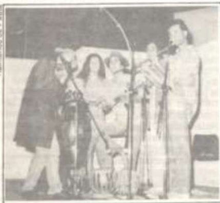
Alguns integrantes do grupo teatral MIMBA KUERA.

Para o show no Centro de Vivência, os artistas trouxeram o espetáculo denominado "Brasil, que história é essa?", reunindo manifestações artísticas de dife-