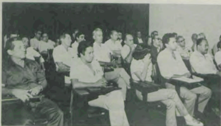
Os agrônomos do Banco do Brasil, participantes do curso.