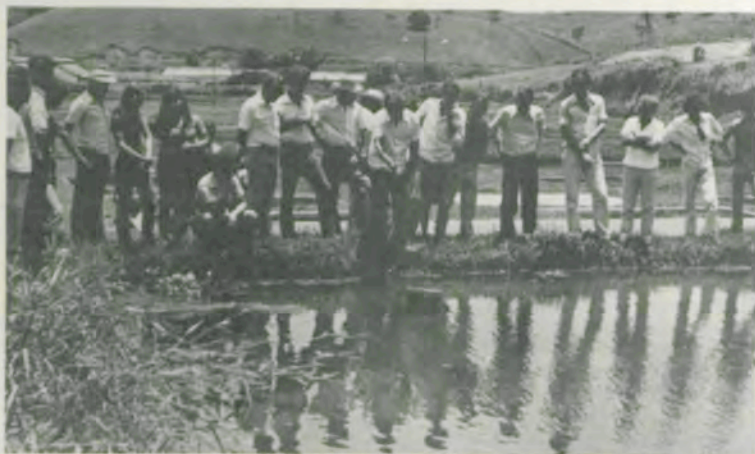
Visita à Estação de Piscicultura da UFV.

plantio; palestra para 35 agricultores, sobre a cultura do feijão; curso sobre corte e costura, com nove participantes; formação de capineiras em quatro propriedades rurais; construção de açudes; implantação de apicultura; demonstração de controle de ectoparasitas em bovinos; atendimento clínico a bovinos; conclusão de um projeto de instalação, para bovinos de leite; levantamento para abastecimento de água residencial, com cinco