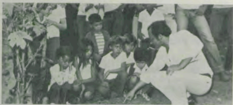
Aula prática na Semana da Alimentação.

Num trabalho integrado com a Prefeitura Municipal, CNAE e Emater-MG, a Escola Média de Agricultura de Florestal (EMAF) desenvolveu trabalhos de campanha por sete dias, durante a Semana da Alimentação.