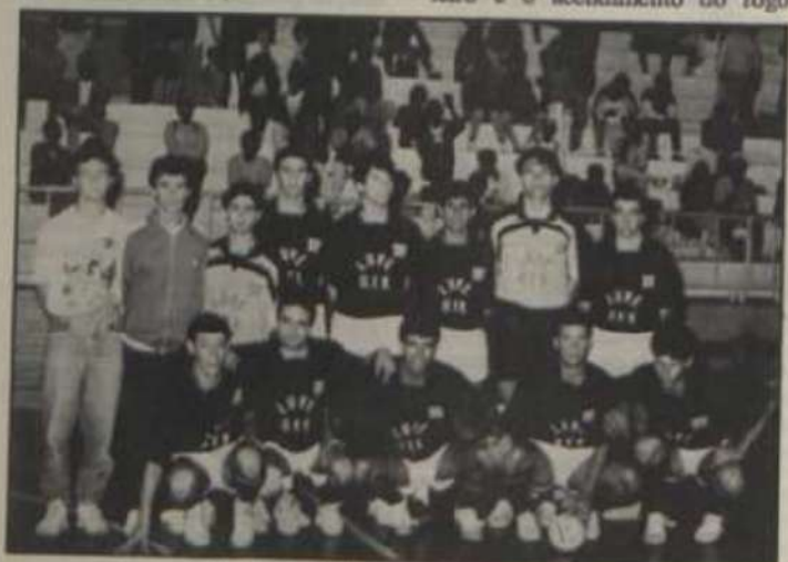
Equipe de futebol de salão da LUVE.

A classificação final geral dos JUM's-92 consagrou a delegação da UFMG como a grande vencedora do torneio e apontou como vice-campeã a equipe da A.A.A. LUVE/UFV. A classificação geral e o número de pontos obtidos pelas delegações são os seguintes: 1º lugar: UFMG (77 pontos), 2º lugar: LUVE (75 pontos), 3º lugar: UFU (73 pontos), 4º lugar: UFJF (37 pontos), 5º lugar: UNA (14 pontos) e 6º lugar: UFOP (12 pontos).