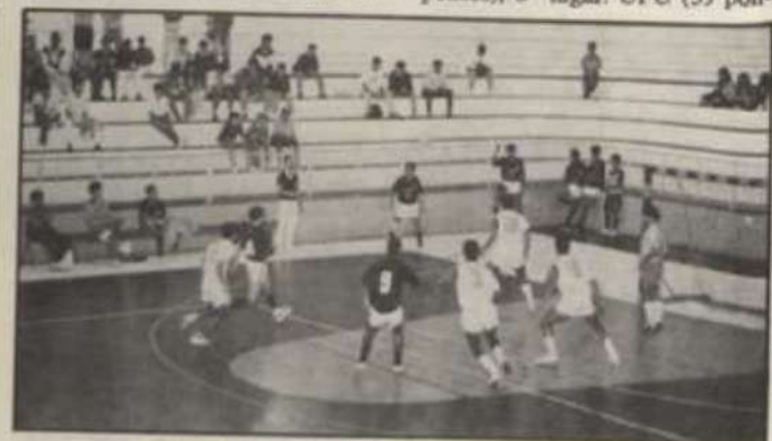
Partida de futebol de salão no ginásio da UFV.

A solenidade teve início com a audição do hino nacional brasileiro e o acendimento do fogo