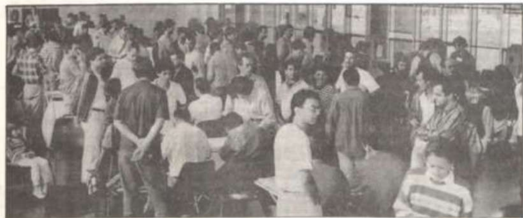
Aspecto da votação na manhã de ontem no Centro de Vivência.