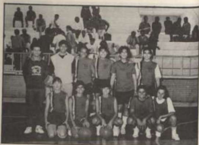
Equipe de basquete feminino da LUVE.