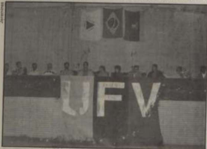
A mesa que presidiu a solenidade de abertura.

A classificação final nas modalidades masculinas definiu a seguinte colocação: 1º lugar: LUVE (48 pontos), 2º lugar: UFMG (40 pontos), 3º lugar: UFU (39 pon-