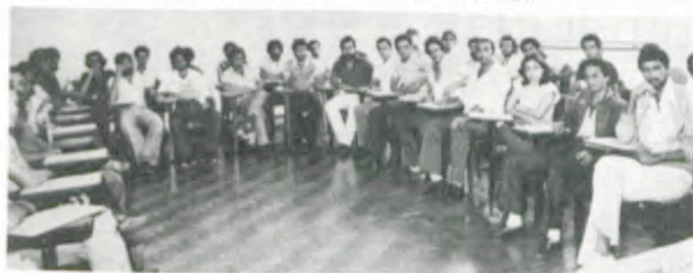
Os técnicos da Emater-BA.

As inscrições para o «Dia de Campo» devem ser feitas até o próximo dia 16, no Núcleo de Estágio do Centro de Ensino de Extensão (CEE).