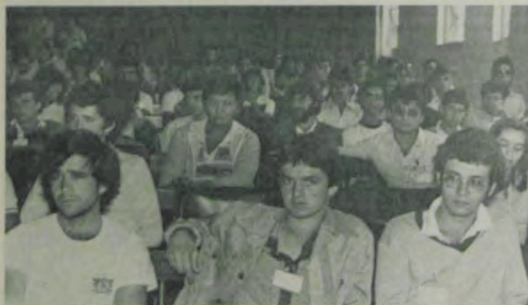
Estudantes de vários Estados participaram dos congressos.

O I Congresso Nacional de Estudantes de Zootecnia e o III Congresso Mineiro de Estudantes de Zootecnia, realizados no «campus» da Universidade Federal de Viçosa, de 27 a 30 de setembro, tiveram a participação de cerca de 300 congressistas de 10 escolas do País.