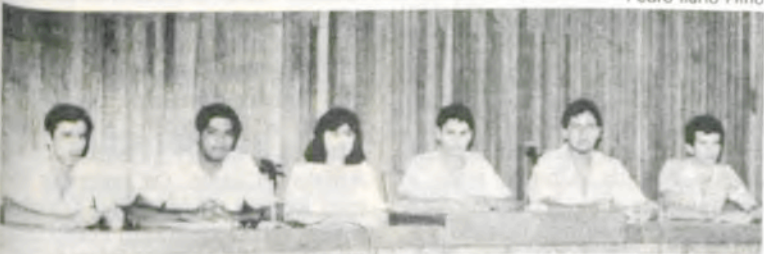
Os novos diretores da Coopasul.

O novo conselho de administração da Cooperativa de Consumo dos Professores, Alunos e Servidores da UFV (COOPASUL) foi empossado dia 20 último, em solenidade realizada no auditório do Edifício Reinaldo de Jesus Araújo, às 19h.