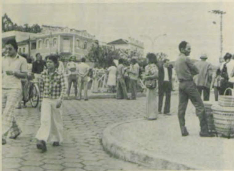
Todos os meses, a Feira de Artesanato será um dos elos de integração da UFRV com toda a microrregião de Viçosa.

Os prefeitos das 13 cidades participantes da I Feira de Artesanato Regional, aberta, dia 2 último, às 8h, na praça Dr. Cristóvam Lopes de Carvalho, em Viçosa, reuni-