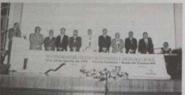
Autoridades presentes à cerimônia de abertura do Congresso.

A entrega do prêmio ocorreu durante o 36º Congresso Brasileiro de Economia e Sociologia Rural, realizado em Poços de Caldas, de 10 a 14 de agosto passado.