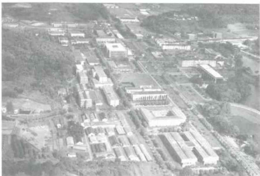
O campus da UFV destaca-se por sua beleza.

Esperamos que, com a avaliação de todas as nossas grades curriculares e dos programas analíticos de nossas disciplinas, aproveitando a flexibilidade das novas diretrizes curriculares, em discussão no MEC, em muito aperfeiçoemos nosso processo de formação acadêmica. Esta avaliação mais ampla, que certamente terá que envolver todos os professores,