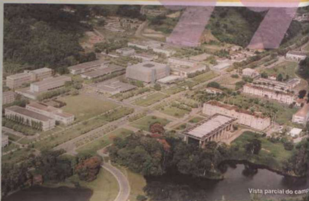
Vista parcial do campus

Estão abertas, até o próximo dia 25, as inscrições para o Vestibular/99 da Universidade Federal de Viçosa. As provas para o preenchimento de 1.259 vagas serão realizadas nos dias 28, 29 e 30 de dezembro, em 18 cidades brasileiras. Para se inscrever, o candidato deverá procurar uma das agências dos correios credenciadas pela UFV em todo o País. A taxa de inscrição é R$60,00 e o Manual do Candidato custa R$5,00.