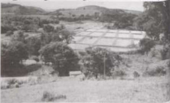
Vista parcial do Núcleo.

A Empresa de Pesquisa Agropecuária de Minas Gerais (Epamig), com apoio da Fundação de Amparo à Pesquisa de Minas Gerais (Fapemig), inaugura as novas instalações da Sede Administrativa da Fazenda Experimental de Leopoldina (FELP) e do Núcleo de Pesquisa e Desenvolvimento