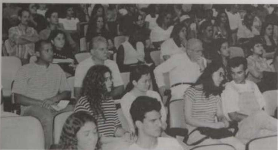
Parte do público que lotou o Auditório da BBT.