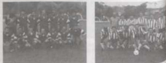
As equipes que fizeram o jogo de abertura da competição.

Os jogos são promovidos pela Pró-Reitoria de Assuntos Culturais, com apoio das entidades sindicais dos servidores, Departamento de Educação Física e todos os órgãos de imprensa de Viçosa.