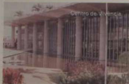
Centro de Vivência