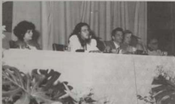
Aspecto da abertura do II Colóquio de Filosofia.

Ao promover o encontro, os organizadores tiveram por objetivos aprofundar e atualizar conhecimentos em Filosofia, nos campos de reflexão da teoria do conhecimento da filosofia política, da filosofia da educação e da estética; estimular a análise, a reflexão e a crítica sobre a produção e apropriação do conhecimento como instrumento para a práxis dos homens; oportunizar a formação permanente de docentes, aprofundando e atualizando seus conhecimentos nas áreas de filosofia, bem como contribuindo para construir um sentido para sua prática pedagógica; e gerar condições que propiciem a formação e a pesquisa em Filosofia e Filosofia da Educação.