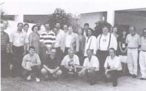
Representantes das editoras universitárias de todo o Brasil participaram da reunião em Natal.

A XI Reunião Anual da Associação Brasileira das Editoras Universitárias (ABEU) foi realizada no período de 13 a 17 de julho, no campus da Universidade Federal do Rio Grande do Norte, em Natal.