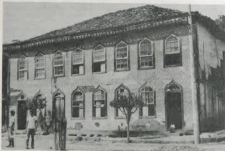
Sobradão, estilo colonial, com traços góticos, de Pedra do Anta, que necessita de restauração.

Em Pedra do Anta, o Programa Gilberto Melo da Universidade Federal de Viçosa, criado em convênio com o Banco Central do Brasil e Caixa Econômica do Estado de Minas Gerais, desenvolve outras atividades, tais como: ensino de novas técnicas de plantio no meio rural; adubação; conservação do solo; reflorestamento e preservação de matas naturais; análise de qualidade e fórmulas de tratamento de água; construção de hortas escolares e domiciliares; corte e costura; preparo de alimentos; industrialização doméstica; apicultura e piscicultura; assistência veterinária; capacitação de professores rurais e cantineiras; lazer, através do esporte e teatro de fantoche, levando às crianças mensagens de saúde, higiene e alimentação. Também será realizado um levantamento sobre a existência do barbeiro, causador da Doença de Chagas.