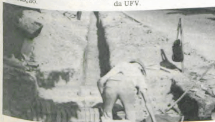
Uma das caixas da nova rede.

Com as novas instalações, a Universidade deverá contar com 810 ramais telefônicos, numa etapa inicial, passando a 3.000, em capacidade plena, permitindo-se ainda o funcionamento da Discagem Direta ao Ramal (DDR) e o uso do módulo tarifador. A atual capacidade — 20 troncos — será ampliada para 80, sendo 40 para entrada e a outra metade para a saída. A central em funcionamento opera 370 ramais, o que é insuficiente para as necessidades da Instituição.