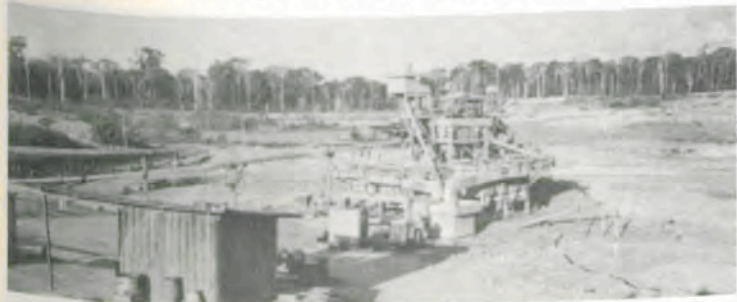
Uma das áreas mineradas.