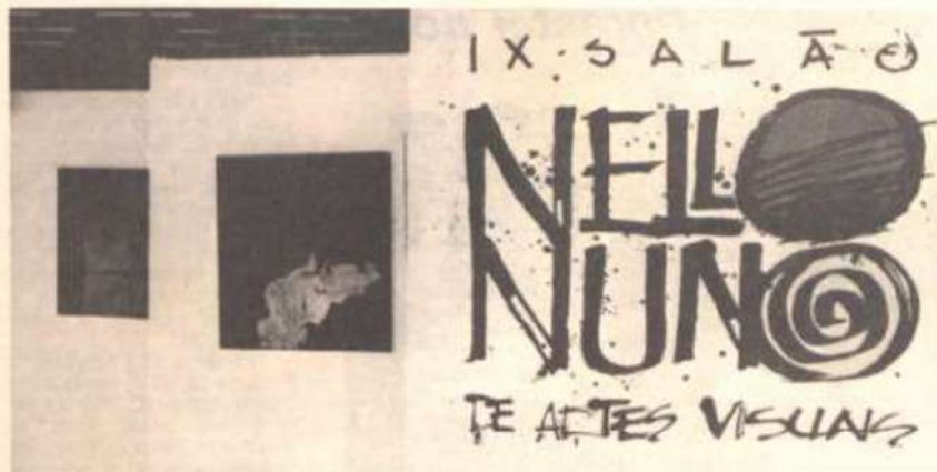
O Salão Nello Nuno foi realizado pela última vez em 1989.

Seminários, troca de experiências e palestras serão as atividades desenvolvidas durante os quatro dias do "Seara-93". Missas - celebradas diariamente - e confissões também fazem parte da programação. Esse evento acontece todos os anos e é uma oportunidade para as práticas da meditação e auto-avaliação, tão importantes nos dias de hoje.