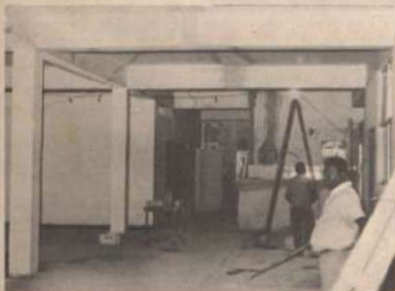
O prédio do Restaurante Universitário está sendo totalmente recuperado.