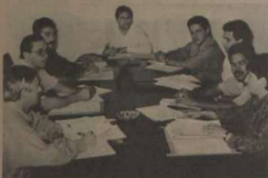
Constantes reuniões técnicas são realizadas para ultimarem detalhes do Simpósio.

Está confirmada para o período de 11 a 14 de maio a realização do I Simpósio de Pesquisa da Sociedade de Investigações Florestais (SIF), em evento que reunirá pesquisadores e técnicos de empresas do setor florestal de todo o País. "Novos rumos da