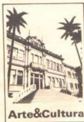
Fac-símile da capa do novo Catálogo.

DAC, PMV e Emater «convocam» artesãos da região