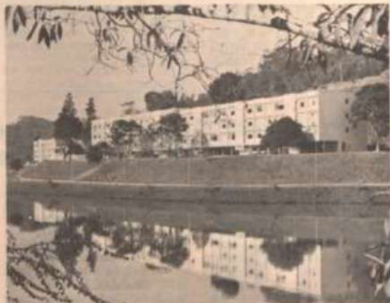
Alojamentos: uma questão delicada.