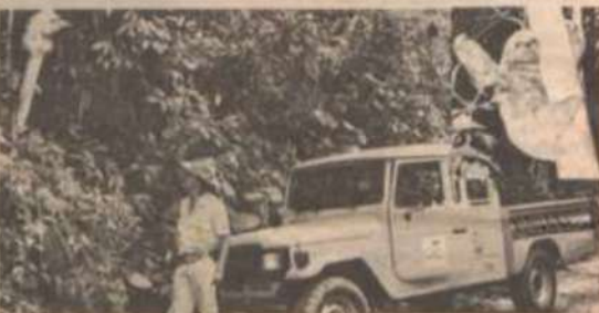
O bicho-preguiça (no detalhe) foi solto na Mata do Paraíso.

No dia 18 de janeiro último, um estudante entrou em contato com os técnicos do CMCN, informando a captura de um animal conhecido como "cachorro-do-mato". Segundo o estudante, o animal, capturado no sítio "Córrego dos Barros", estava causando prejuízos aos agricultores, pois devorava galinhas. A Polícia Florestal foi informada e buscou o cachorro-do-mato ( Dusicyon thous ), levando-o para o Hospital Veterinário do Departamento de Veterinária da Universidade Federal de Viçosa. Feitos os exames de rotina, o animal foi liberado, sob o Termo de Soltura nº 1630.