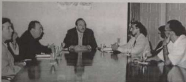
Cerimônia de assinatura do convênio

Os produtores locais de artes cênicas acabam de receber grande impulso para suas promoções: um convênio entre a Universidade Federal de Viçosa e o Ministério da Cultura viabilizará a aquisição e instalação de equipamentos de som e de iluminação no Teatro do Departamento de Economia Doméstica e no Centro de Vivência. O convênio foi assinado no dia 27 de julho, em cerimônia na Reitoria, com a presença de diver-