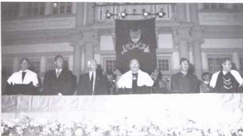
Personalidades presentes à solenidade