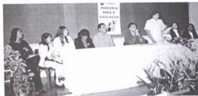
Momento da abertura do evento

Aconteceu, no dia 10 de junho, às 9h, na Sala 10 do Centro de Ensino de Extensão da UFV, a cerimônia de abertura de outra etapa do treinamento que a UFV oferece a alfabetizadores provenientes de Alagoas, no âmbito do Programa de Alfabetização Solidária.