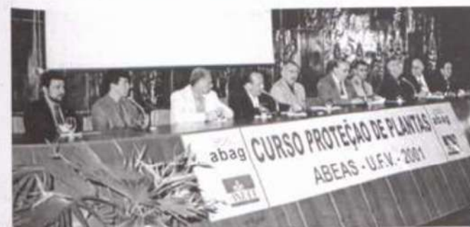
Autoridades que compuseram a mesa de abertura

Foi realizado, no período de 1º a 7 de julho, na Universidade Federal de Viçosa, o 1º Encontro Nacional do Curso de Pro-