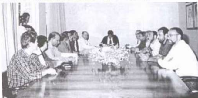
Flagrante da reunião com os prefeitos