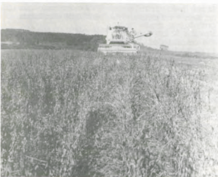
A colheita da soja UFV-2 na EMAF.