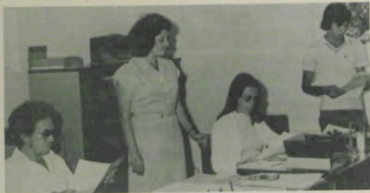
A Assessoria funciona atrás da Reitoria da UFV.