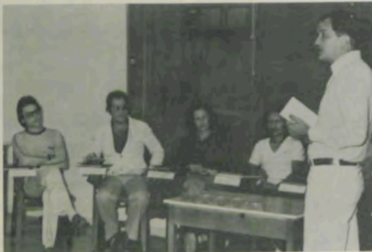
O Encontro no CEE.