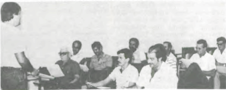
Uma das aulas do treinamento.