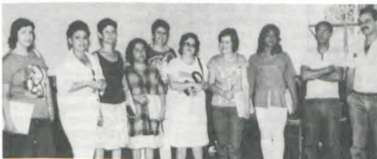
Algumas das telefonistas, os instrutores e o coordenador do curso.

A primeira turma fora treinada no período de 10 a 12 de dezembro do ano passado, com o mesmo conteúdo e carga horária.