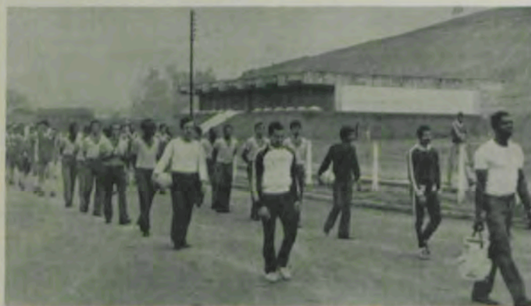
A equipe da Vigilância conquistou o primeiro lugar no desfile de abertura do campeonato.