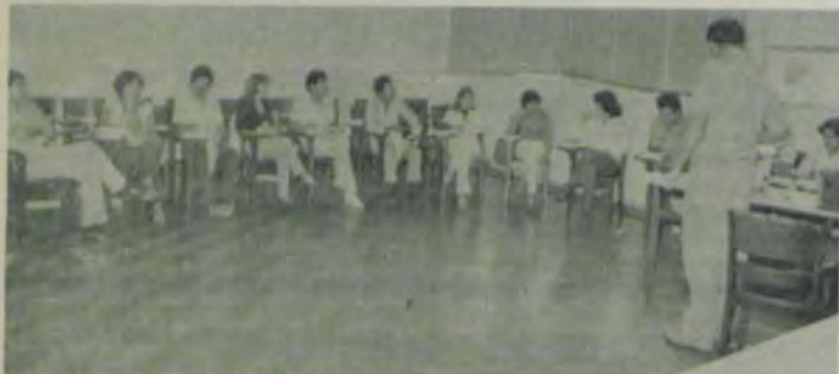
Os professores e alunos do Seminário, realizado no Centro de Ensino de Extensão.

Participaram do Seminário 16 professores do Departamento de Administração e Economia, Educação e membros da Segeplan, que receberam 40 horas/aulas, em duas etapas, visando à construção de um caso experimental, que alcançou pleno êxito.