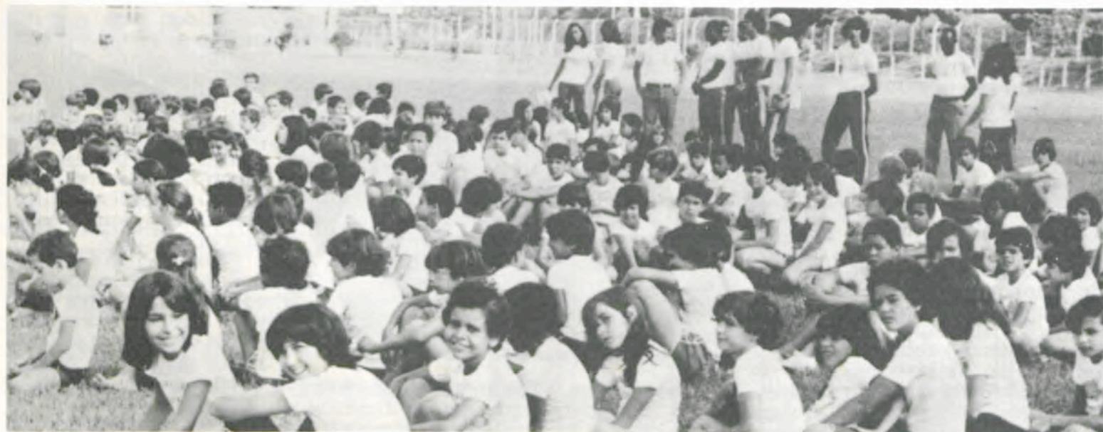
É a UFV proporcionando muita alegria para as crianças da comunidade viçosense.

A Universidade Federal de Viçosa (UFV) oferecerá à comunidade viçosense, no período de 14 de janeiro a 1.º de fevereiro do próximo ano, a II Colônia de Férias, da qual podem participar crianças de sete a 12 anos de idade. O número de participantes será de 300.