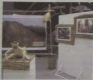
O quadro na tela ao fundo reproduz a Serra do Brigadeiro