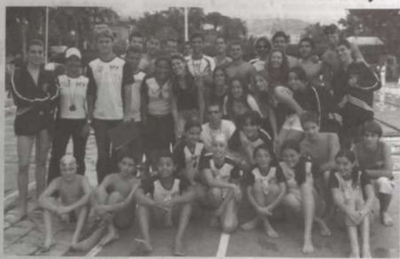
Delegação do Projeto Nadar/Luve que participou da terceira etapa do 3º Circuito Mineiro de Natação