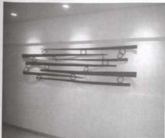
Um dos trabalhos expostos na mostra