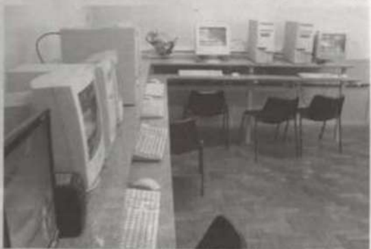
Os computadores da Sala de Informática do Alojamento Feminino poderão ser usados por qualquer aluno da UFV