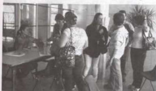
As inscrições dos participantes foram realizadas no hall do Centro de Vivência da UFV

Teve início nos dias 5 e 6 deste mês, no campus da Universidade Federal de Viçosa, com a primeira semana presencial, realizada no Espaço Acadêmico-Cultural "Fernando Sabino", no Centro de Vivência da UFV, o Curso de Pós-Graduação Lato Sensu em Gestão Escolar, voltado