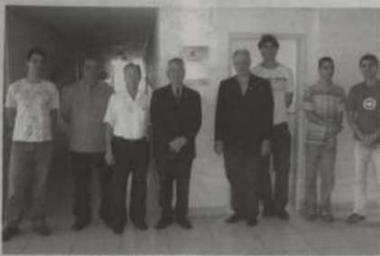
Autoridades acadêmicas e alunos responsáveis pela instalação do laboratório