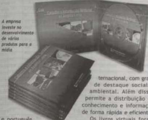
A empresa investe no desenvolvimento de vários produtos para a mídia

Como resultado desses anos de trabalho conjunto, a Studium desenvolveu o CD-Rom "Cadastro y Información Territorial em América Latina", que contém quatro livros virtuais (e-books) publicados pelo LILP, além de vídeos com informações adicionais e encarte em espanhol