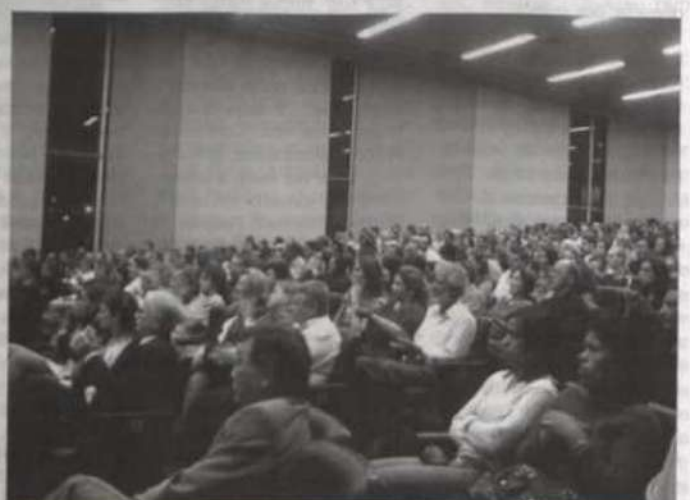
Grande parte da comunidade universitária, familiares e convidados prestigiaram a solenidade