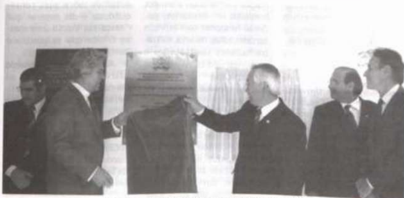
Momento da inauguração das novas instalações da RTV

para difusão do sinal da TV Viçosa, já que o município foi o primeiro a receber a torre de ampliação de transmissões da TV. Para encerrar, foram concedidas homenagens aos principais meios de comunicação de Viçosa, ao Jornal Estado de Minas, à TV Panorama, ao Programa Globo Rural, à Revista Business Rural, à TV Alterosa, ao Jornal Diário do Comércio e à Revista Guia do Estudante, assim como a alguns de seus jornalistas.