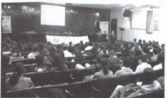
O evento foi prestigiado por grande número de profissionais e estudantes

(Fernando Faria - Colaboração: Josélia Carvalho)