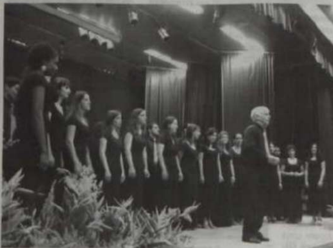
A apresentação do Coral da UFV deu início à cerimônia