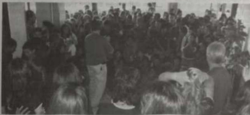
O Coral da UFV em uma escola de Cabo Frio, numa prévia da programação oficial

O Coral da UFV foi um dos grupos convidados para apresentações no 22º Encontro de Corais de Cabo Frio, promovido pela Prefeitura Municipal de Cabo Frio e realizado no período de 13 a 20 deste mês, chegando à 17ª Edição Internacional.