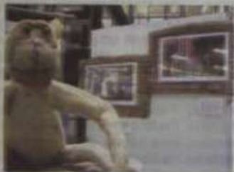
A mostra também contou com bonecos de muriquis confeccionados em bucha vegetal

Sob o olhar atento dos fotógrafos André Berlink, Cláudio Pontes, Leandro Santana Moreira e Thiago Gomide, os trabalhos apresentados na mostra traziam imagens da Serra do Brigadeiro e dos animais que aí se encontram, principalmente os muriquis, que são pequenos micos preservados da extinção.