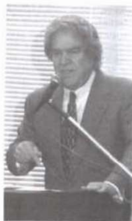
O ministro Hélio Costa durante sua palestra