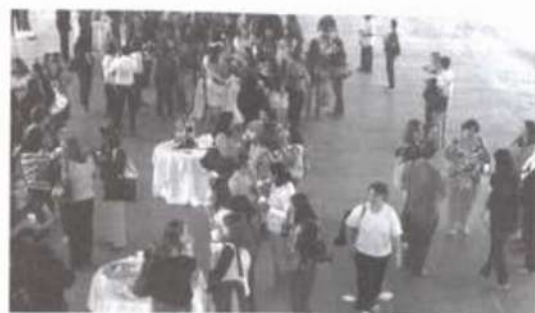
Os profissionais da Educação Básica participaram de um coffee-break de confraternização

Considerando os pressupostos, os objetivos, a natureza e a dinamicidade da proposta pedagógica do curso, as atividades a serem