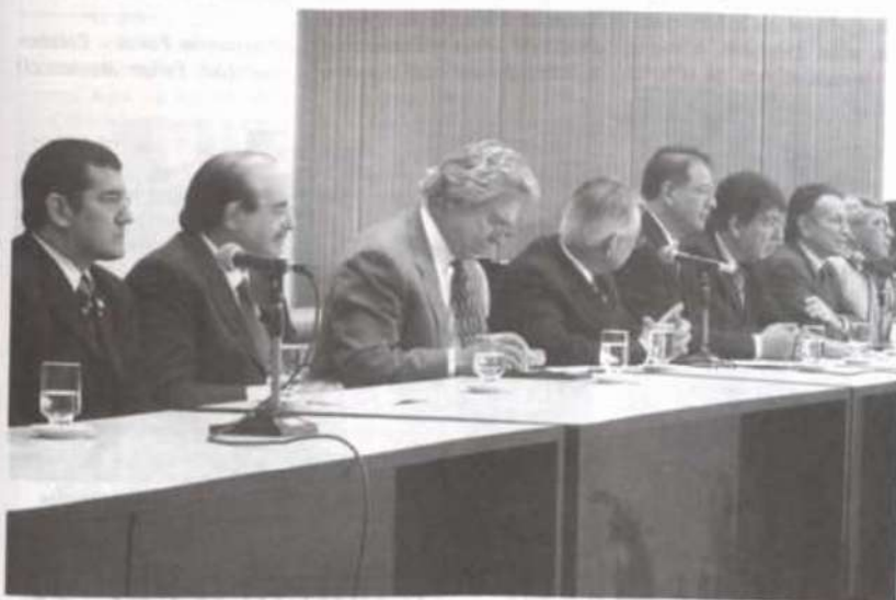
Autoridades que compuseram a mesa de abertura da cerimônia no auditório da BBT