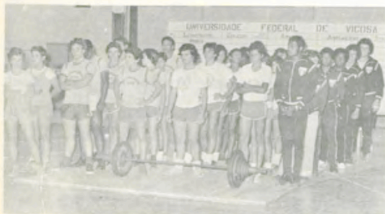
Os participantes do Campeonato de Levantamento de Pesos.

A equipe da Escola Estadual Dr. Raimundo Alves Torres, com 64 pontos, venceu o Campeonato Infanto-Juvenil de Levantamento de Peso de Viçosa, realizado, dia 14 último, no Ginásio de Esportes da UFV, diante de um público que vibrou com a competição promovida pelo Departamento de Educação Física da UFV.