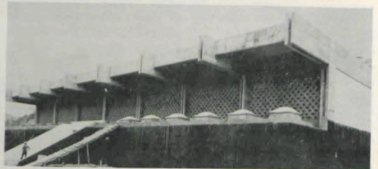
Pavilhão de Ginástica, na Praça de Esportes.