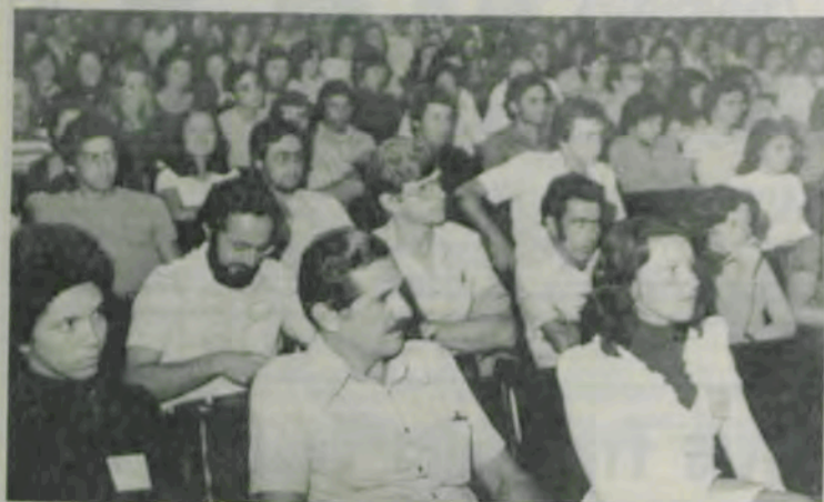
Alunos, técnicos e estudiosos foram ouvir as palestras da I Semana de Biologia.

Mais de 300 estudantes e professores de Biologia participaram da 1. a Semana de Biologia, sob o tema "Ambiente e Vida", realizada no auditório da Escola Superior de Florestas da UFV, de 8 a 13 de setembro, promovida pelos universitários de Ciências Biológicas da Universidade