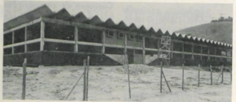
Obras de construção da Imprensa Universitária.