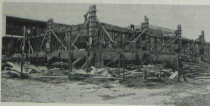
Obras de construção de mais uma ala do Departamento de Fitotecnia da ESA.