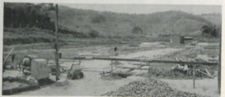
Obras de construção do Laboratório de Pesquisas com Animais, do Departamento de Zootecnia da ESA.