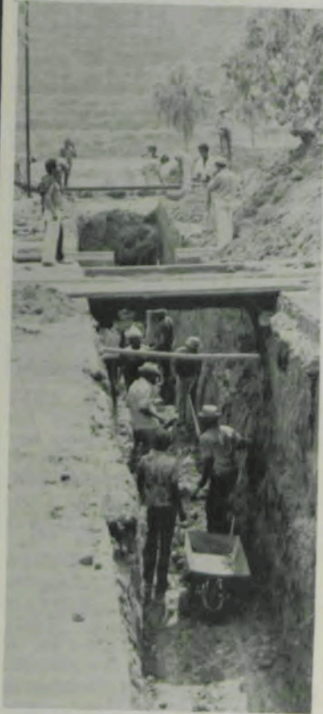
Canalização de águas pluviais, na avenida de acesso à UFV.

Diversas obras estão em andamento no "campus" da Universidade Federal de Viçosa, todas elas de grande importância para o pleno desenvolvimento da Instituição. No que diz respeito à infra-estrutura, destacam-se os ser-