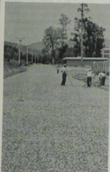
Asfaltamento da avenida da Agronomia.