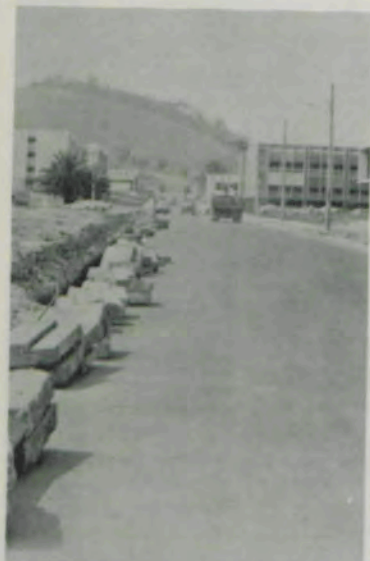
Colocação de meios-fios na avenida que liga o "campus" à Vila Gianetti.