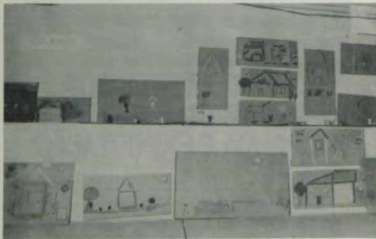
Trabalhos de colagem.

Participam da IV Colônia de Férias crianças com idade de sete a 12 anos, que estão tendo aulas práticas de esportes, artes, cultura e muita diversão, destacando-se os trabalhos manuais com a utilização de papel, tintas e objetos diversos, como copos de plástico, palitos de fósforo e pedaços de madeira. Foi organizada exposição desses traba-