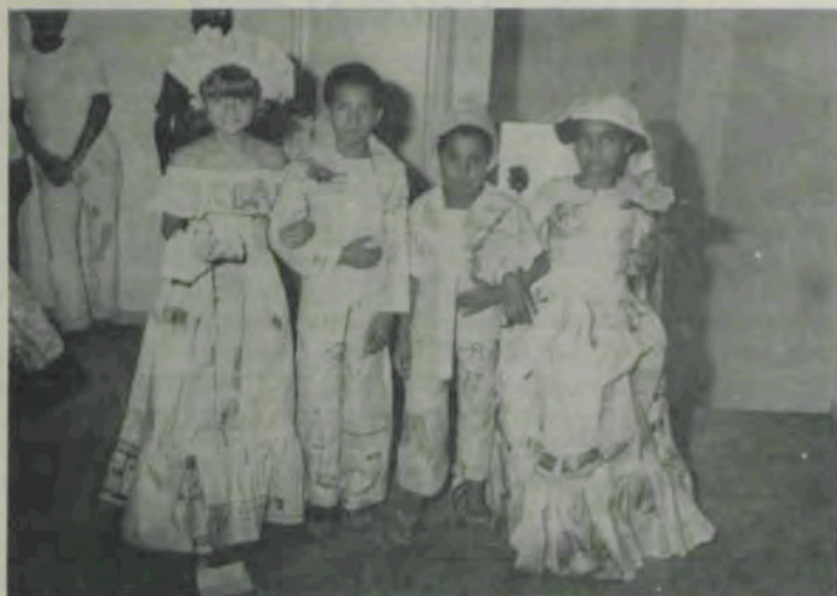
Vestuário em papel jornal: uma das tarefas da gincana.

Com a participação de 418 crianças, termina, amanhã, a IV Colônia de Férias da Universidade Federal de Viçosa (UFV), iniciada dia 11 do corrente, numa promoção do Departamento de Educação Física do Centro de Ciências Biológicas e da Saúde e do Conselho de Extensão. O encerramento será às 10h30m, no Ginásio de Esportes, com a realização de um Carna-