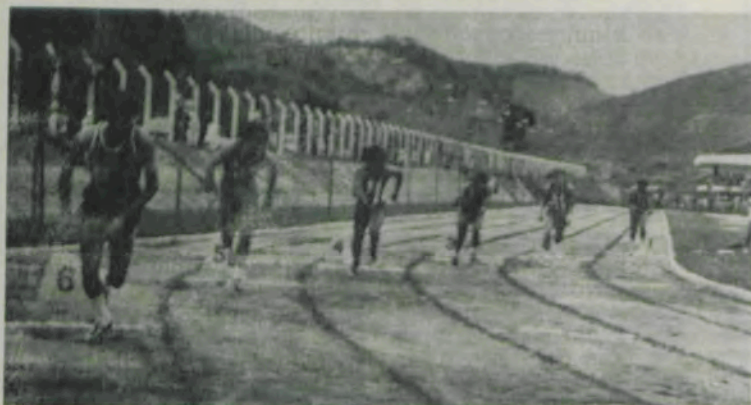
A prova dos 200 metros rasos.