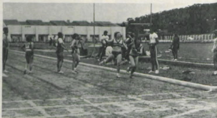
A passagem do bastão. Vitória das atletas de Viçosa.