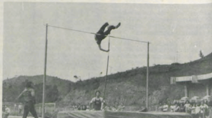
O salto com vara.