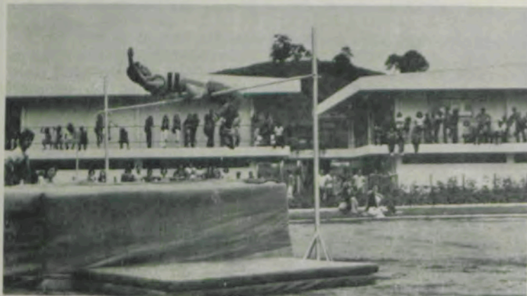
O salto em altura.