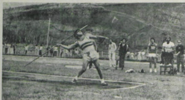
O arremesso do dardo.