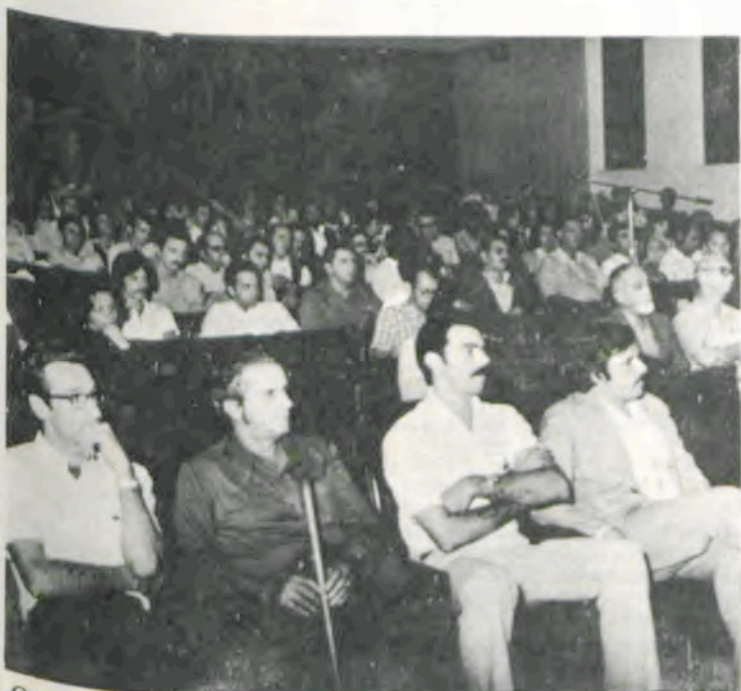
Os professores dialogaram com o reitor, após sua explanação.

bolsista do governo brasileiro, na Alemanha. Foi diretor do Seminário Livre de Música da Universidade da Bahia e do Conservatório de Pelotas, Rio Grande do Sul. Atualmente, é professor da Universidade Estadual de Campinas, São Paulo, um dos mais avançados centros de ensino de artes da América do Sul. É considerado pela crítica especializada um dos melhores intérpretes contemporâneos. Apresentou-se em diversos recitais e concertos com orquestras, em muitos países da Europa, Ásia e Américas do Norte e do Sul.