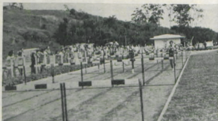
Os 100 metros sobre barreiras.