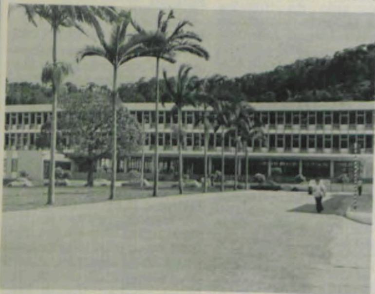
As plantas circundam prédios, ruas e avenidas.

Aí está a UFV, com toda a sua pujança, a enfileirar-se entre as grandes universidades brasileiras. Avançada em sua estrutura, pioneira em numerosas iniciativas, aberta a todas as formas de cultura e de grandeza humana!