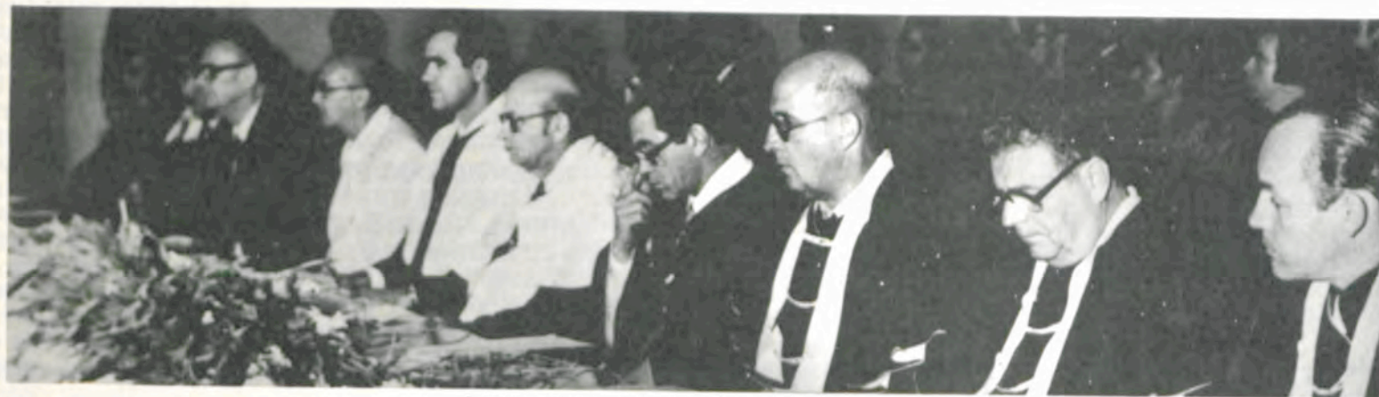
A mesa que dirigiu a sessão solene desta noite.