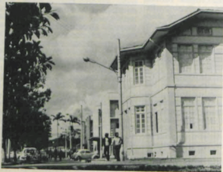
Aqui, os estudantes vivem parte de suas vidas.