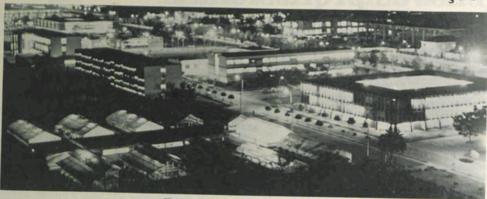
Vista parcial noturna do «campus» da UFV.

Graças à inteligência, à dedicação, à vontade de servir, ao espírito construtivo, ao altruísmo, à luta ininterrupta e aos homens em que se encerram todos esses dotes, a Universidade Federal de Viçosa (UFV) existe, hoje, na plenitude da sua universalidade.