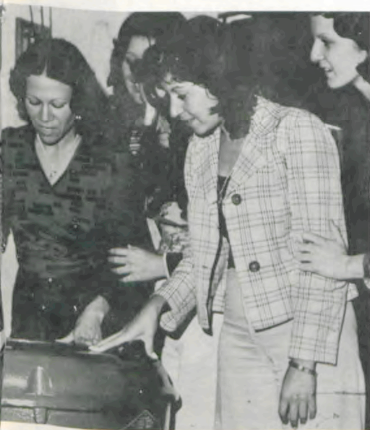
Em Economia Familiar as alunas aprendem a fazer, fazendo.

Com o lançamento das licenciadas em Economia Doméstica na vida profissional, a UFV oferece ao processo de desenvolvimento global do Brasil a mão-de-obra qualificada, necessária ao trabalho de elevação dos níveis de vida da família brasileira.