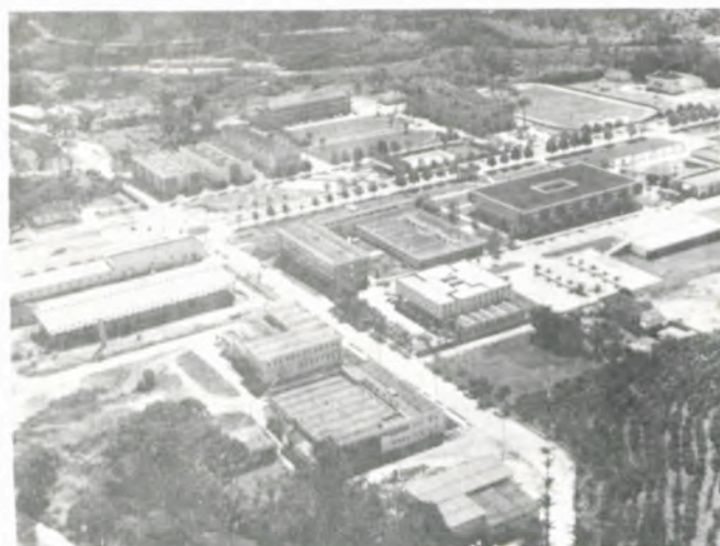
O "campus" da UFV.

A Universidade Federal de Viçosa, em seu contínuo trabalho para encurtar a distância que nos separa das nações mais avançadas do globo, está abrindo suas portas e recebendo jovens de todo o País, que estarão, a partir de domingo próximo, disputando uma vaga no seu vestibular unificado. São 2057 candidatos.