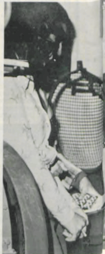
Também, no Departam

Dentro da alta costura, algumas técnicas são empregadas na construção de peças especiais, usando tecidos e fibras que oferecem problemas de construção, tais como: crepes, rendas, malhas, veludo, lã, algodão, rayon, acetato, nylon, poliéster e seda. Visto ser Vestuário uma disciplina profissionalizante, seu mérito torna maior e sua necessidade