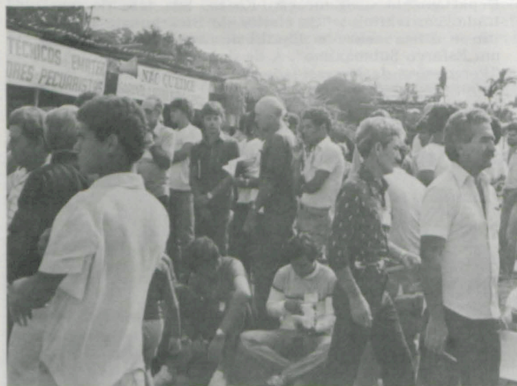
Os produtores preparam-se para as aulas teóricas e práticas, divididos em diversos grupos.