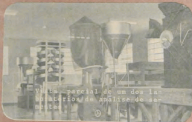
Vista parcial de um dos laboratórios de análise de semente