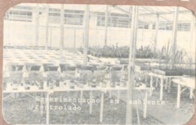
Experimentação em ambiente controlado.

com sua presença atuante em várias partes do Estado, sobretudo no Triângulo Mineiro. São 127 projetos de pesquisa e desenvolvimento, o que mobiliza recursos da ordem de Cr$ 500.000,00. Entre outros, destacam-se os referentes à introdução de variedades e linhagens de feijão resistentes à ferrugem do cafeeiro, produção de sementes híbridas de milho e uso da esterilidade citoplasmática em uma nova variedade de feijão 'Rico-896', de alta produtividade (que será liberado próximamente), ao programa de melhoramento da soja (estudam-se, no Estado, 2.500 linhas, das quais duas se destacam com produções 30% superiores às melhores variedades em uso), aos levantamentos de solos na Bacia do Rio São João e ao manejo do solo no Triângulo Mineiro.