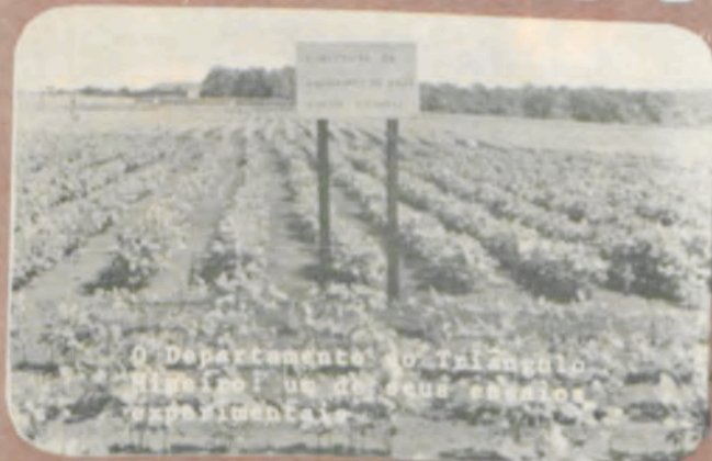
O Departamento no Triângulo Mineiro: um de seus campos experimentais.

Como embasamento das realizações mencionadas, há no Departamento de Fitotecnia da ESA facilidades físicas, cotidianamente enriquecidas, um corpo técnico de invejável qualificação (num total de 36 professores, 24 têm curso de mestrado no país e 9 no estrangeiro, além de 7 que possuem o doutorado - Ph.D.) e com alto e dignificante espírito de trabalho e de amor a esta Instituição.