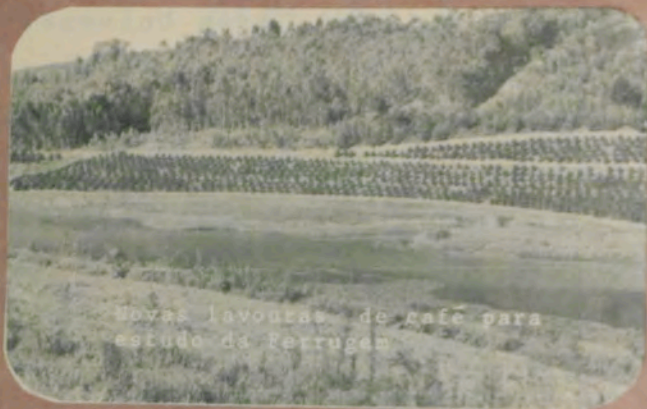
Novas lavouras de café para estudo da ferrugem