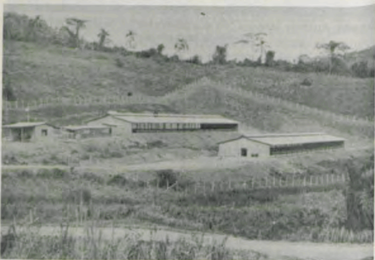
Os novos galpões construídos para dar suporte ao Programa de Melhoramento Genético de Aves.