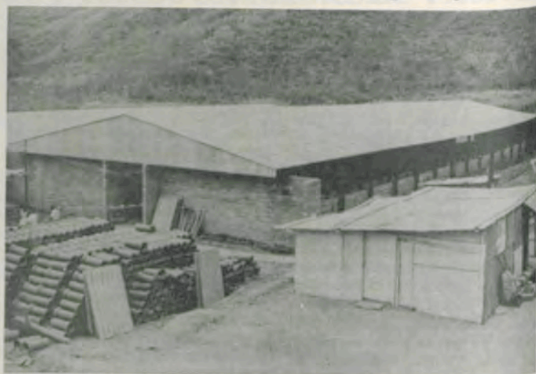
Parte do complexo de suinocultura, cujas obras deverão estar concluídas em 90 dias.

Outra obra de fundamental importância para a pesquisa na UFV é a do complexo das instalações de pesquisa da suinocultura, cujas obras complementares estão sendo realizadas pela empresa Revicon, de Belo Horizonte. Trata-se de um complexo de área total de 11 mil metros quadrados, três mil dos quais de