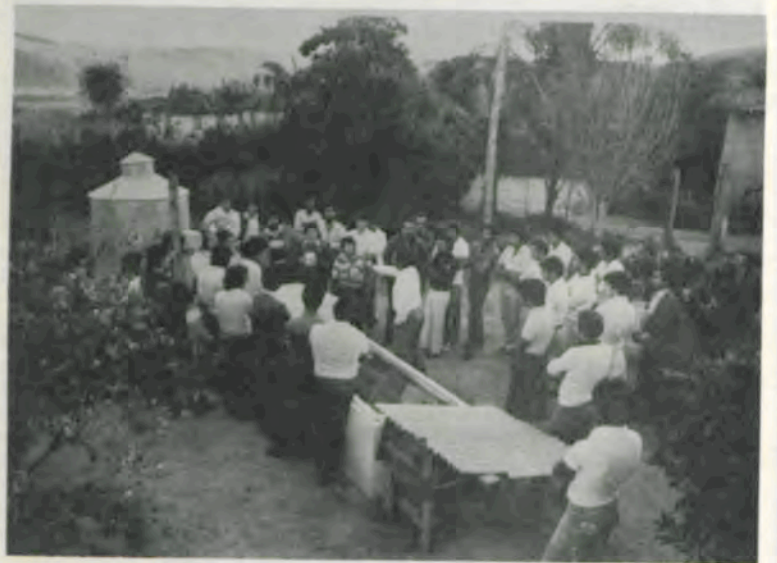
Visita a uma propriedade rural, com experimentos de secagem de grãos com energia solar.