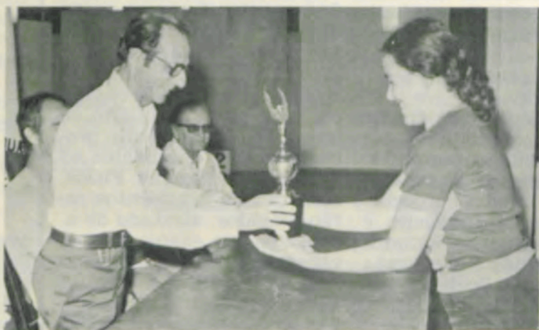
A atleta pontenovense recebe o troféu das mãos do prefeito da sua cidade.