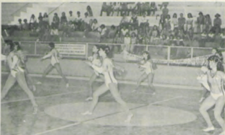
A ginástica rítmica foi uma das atrações do encerramento dos Jogos.