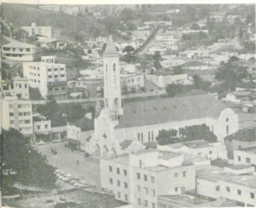
Vista parcial do centro da cidade.

mensura (40 vagas), Ciências, com opções para Matemática, Física, Química e Biologia (75 vagas), Engenharia Civil (40 vagas), Administração de Empresas (50 vagas), Ciências Econômicas (50 vagas), Letras, com opções para Português/Inglês e Português/Francês (40 vagas), Pedagogia (50 vagas), Economia Doméstica (50 vagas), Nutrição (30 vagas), Educação Física (50 vagas), Tecnólogo em Cooperativismo (30 vagas) e Tecnólogo em Latifúndios (30 vagas).