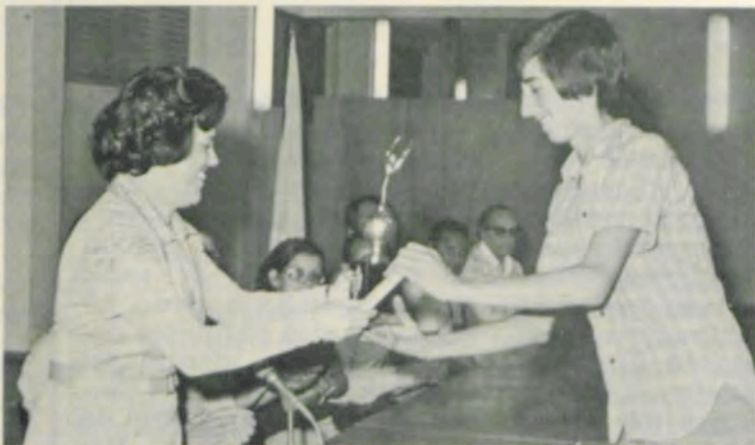
A representante da 20.ª DRE entrega um dos troféus ao atleta viçosense.