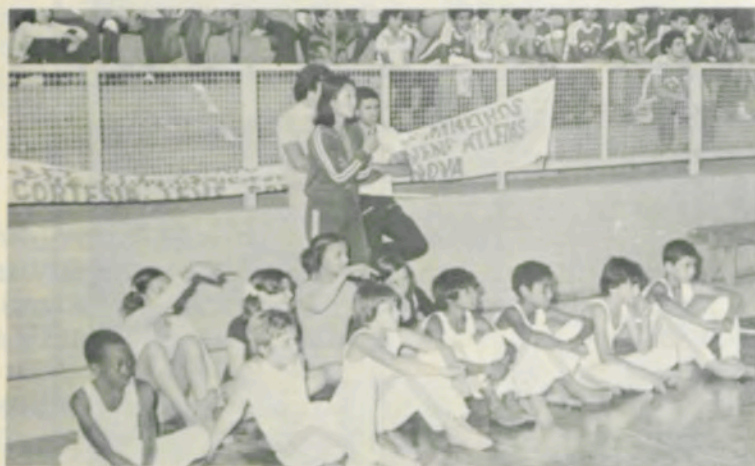
Estes ginastas participaram do encerramento dos Jogos.

Os Jogos, promovidos pela Secretaria da Educação e Universidade Federal de Viçosa, apresentaram os seguintes resultados: Basquete Masculino: 1.º lugar, Viçosa; 2.º, Ponte Nova. Basquete Feminino: 1.º lugar, Ponte Nova; 2.º, Viçosa. Voleibol Masculino: 1.º lugar, Viçosa; 2.º, Ponte Nova; 3.º, Raul Soares. Voleibol Feminino: 1.º lugar, Ponte Nova; 2.º, Viçosa; 3.º, Dom Silvério. Handebol Masculino: 1.º lugar, Ponte Nova; 2.º, Viçosa; 3.º, São Geraldo. Handebol Feminino: 1.º lugar, Ponte Nova; 2.º, Viçosa; 3.º, Raul Soares. Atletismo Masculino: 1.º lugar, Ponte Nova; 2.º, Viçosa; 3.º, São Geraldo. Atletismo Feminino: 1.º lugar, Ponte Nova; 2.º, Viçosa; 3.º, Dom Silvério. Natação Masculino: 1.º lugar, Ponte Nova; 2.º, Viçosa; 3.º, Dom Silvério. Natação Feminino: 1.º lugar, Ponte Nova; 2.º, Viçosa; 3.º, Dom Silvério. Xadrez: 1.º lugar, empatados: Ponte Nova e Viçosa; 3.º, Raul Soares. Judô: 1.º lugar, Viçosa; 2.º, Ponte Nova.