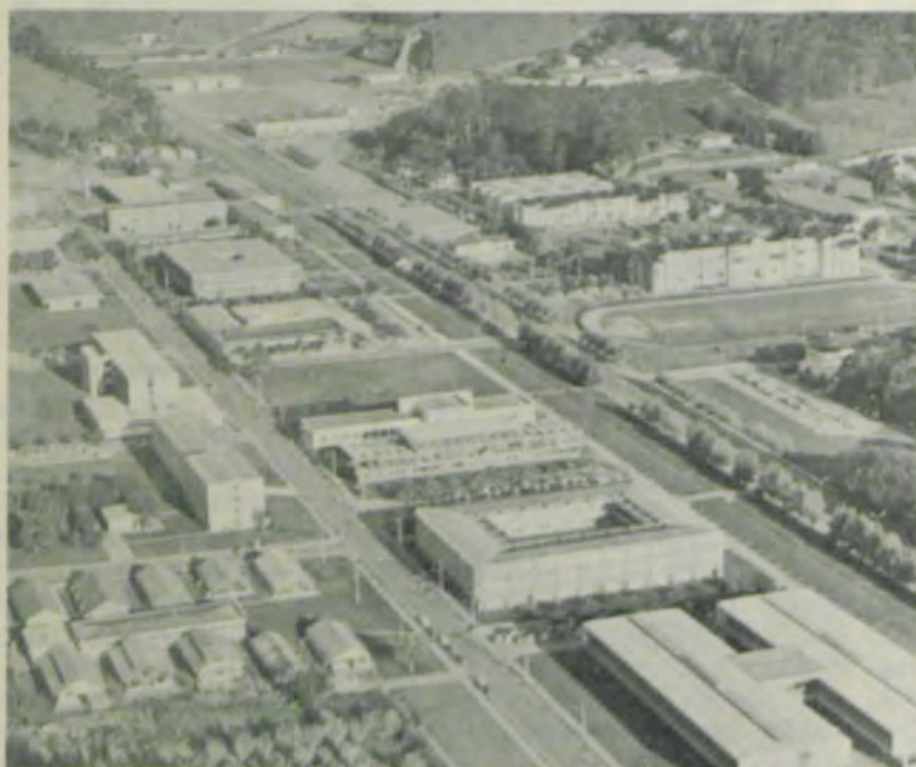
A parte central do «campus» da UFV.