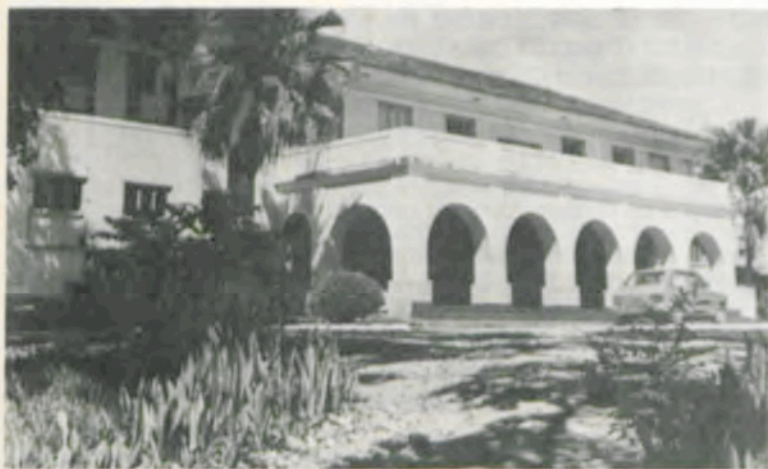
Centro de Treinamento Agrícola, em Florestal.