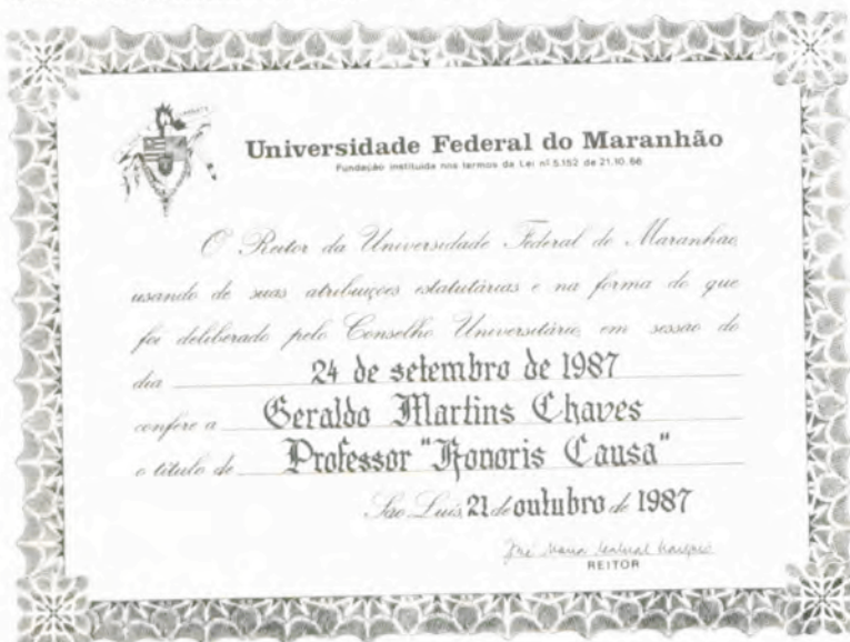
O fac-simile do diploma.