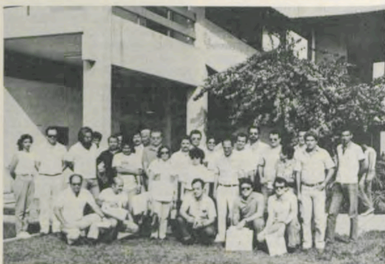
Os visitantes no Hospital Veterinário da UFV.

O Departamento de Veterinária da Universidade Federal de Viçosa (UFV) recebeu, dia 27 de outubro, a visita de 22 médicos-veterinários do Ministério da Agricultura, ligados à área de defesa sanitária animal (SERSA), provenientes de todos os Estados brasileiros.