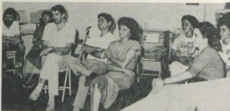
Alguns dos alunos da primeira turma.