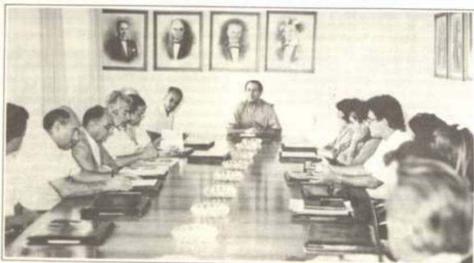
Solenidade de lançamento da obra, na Reitoria.