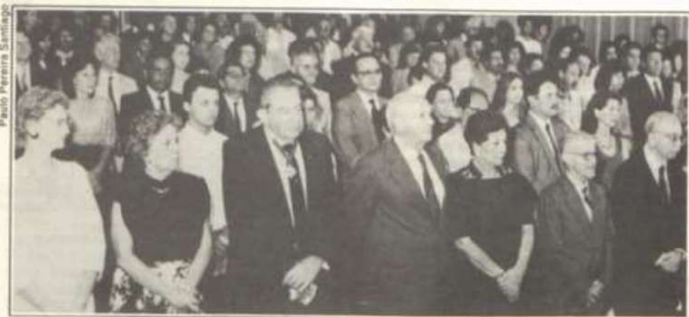
Ex-alunos durante a sessão solene de entrega dos diplomas.