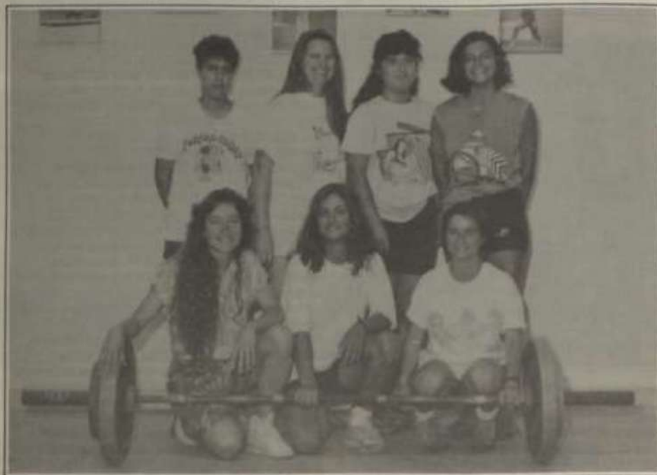
As pesistas da LUCE, campeãs brasileiras/90.

Com um saldo invejável de 10 recordes brasileiros e dois mineiros, a equipe da Associação Atlética Acadêmica/LUCE da Universidade Federal de Viçosa foi a campeã geral do II Campeonato Brasileiro Feminino de Levantamento de Peso, realizado dia oito último, no Ginásio de Esportes da UFV. A LUCE fez 80 pontos contra apenas 27 da segunda colocada, a ASAV, e 16 da terceira, a Sociedade Esportiva Palmeiras. A quarta colocada foi a Associação Esportiva Teixeiraense, que marcou 14 pontos.