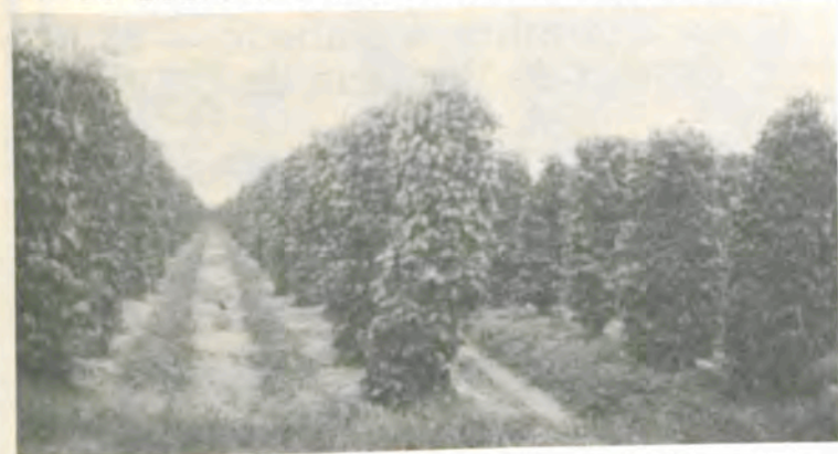
Plantação de pimenta-do-reino no Pará.

A Universidade Federal de Viçosa (UFV) promoveu, através do Centro Acadêmico de Agronomia, o Curso sobre a Cultura da Pimenta-do-Reino, com o objetivo de proporcionar conhecimentos sobre as principais atividades para a implantação e manutenção de um pimental, a importância da pimenta-do-reino para a economia agrícola nacional, além das condições ideais para a obtenção de êxito na exploração racional do produto.