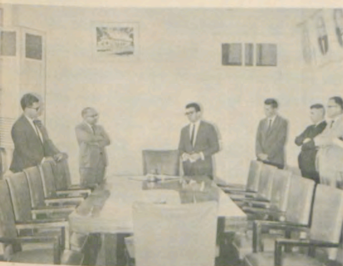
As fotos acima mostram dois aspectos da cerimônia de posse do novo Diretor do Instituto de Economia Rural da ESA da UREMG.