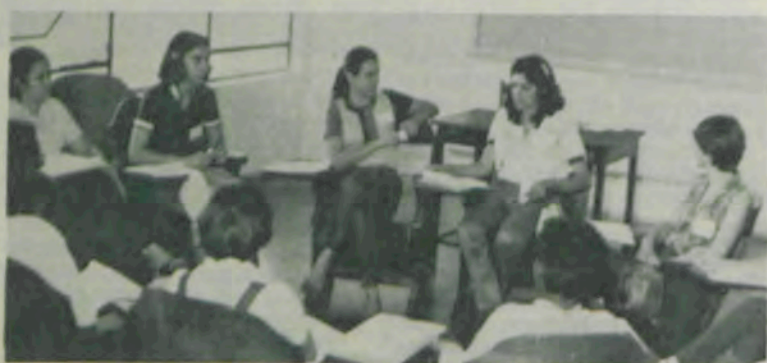
Para discussão dos problemas, foram formados grupos de trabalho, após as palestras.