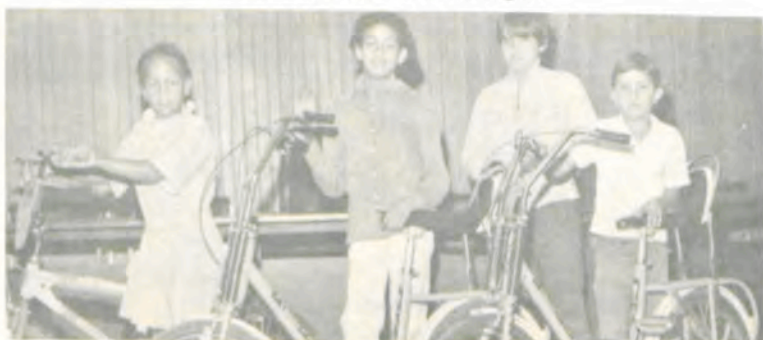
Os ganhadores do concurso de frases sobre a defesa da natureza.