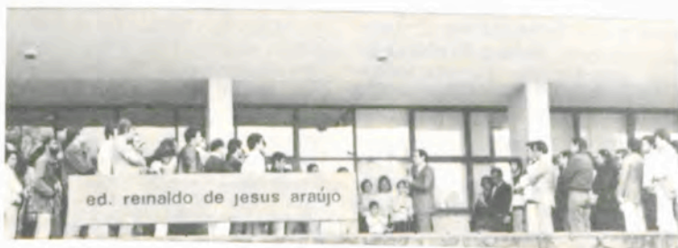
O prédio do Departamento de Engenharia Florestal passou a denominar-se «Ed. Reinaldo de Jesus Araújo».