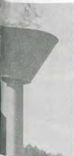
Acende a Pira do Fogo Simbólico.

o Fogo Simbólico, com a ministro Nascimento e da Previdência e Assistên- acendeu a Pira, que ceceu acesa, até a manhã no «campus» da UFV. A do Fogo Simbólico da Pa- correrá várias cidades de Gerais, seguindo, depois, o Horizonte.