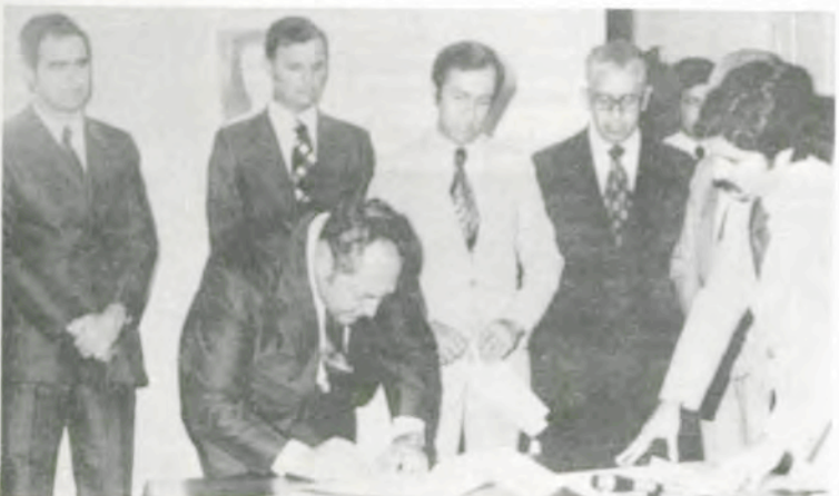
O governador Aureliano Chaves sancionou, hoje, a Lei que dispõe sobre subvenção do Estado à UFV.

Em Sessão Solene de Encerramento das festividades do Cinquentenário da UFV, realizada às 20h de hoje, no Ginásio de Esportes, o Governador Aureliano Chaves recebeu o título de Doutor «Honoris Causa» da Universidade Federal de Viçosa, sendo homenageados, também, os ex-alunos da Instituição.