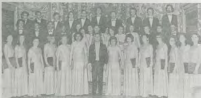
O Coral da AMI.