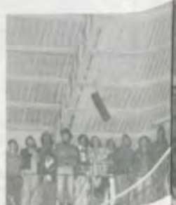
A Equipe da UFV

A Universidade Federal de Viçosa foi a vencedora do concurso de composição do Cinquentenário, disputado nos dias 21 e 22 passados com