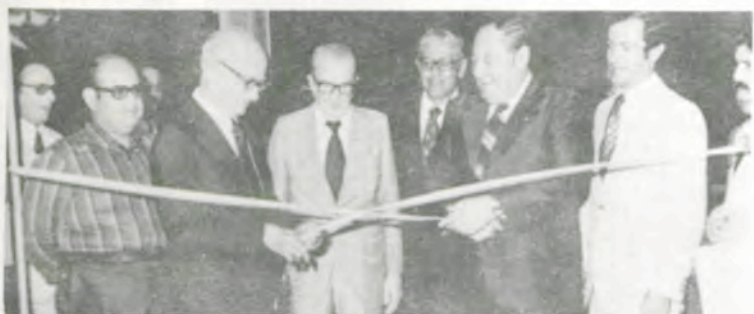
A inauguração das obras de ampliação do Centro Social.