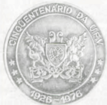
A medalha comemorativa do Cinquentenário.

— A Medalha do Mérito do Ex-Aluno terá as seguintes características: a) Será dourada e terá a forma de uma cruz de Malta, circundada por uma coroa de louros, com um círculo ao centro no qual estará inscrito o emblema da Universidade, a cores, em campo dourado; b) circundando o emblema estará o dístico: Ordem do Mérito do Ex-Aluno — U.F.V. — Viçosa-MG, em ouro, sobre fundo branco; c) a coroa de louros será em ouro; d) os braços da cruz serão em esmalte vermelho, em campo branco, emoldurados em ouro; e) a medalha terá uma fita vermelha, com 25 cm de comprimento e 2,8 cm de largura e será usada pendente ao pesco-