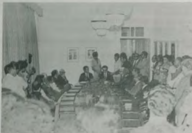
A sessão solene do Conselho Estadual de Trânsito.

Este ano, todos os carros emplacados em Minas Gerais vão circular com uma plaqueta alusiva ao Cinquentenário da Universidade Federal de Viçosa (UFV), que será comemorado, oficialmente, no dia 28 de agosto próximo, em Viçosa.