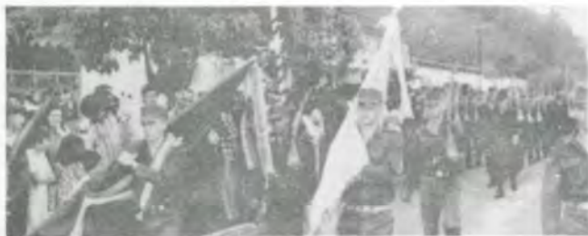
O Tiro de Guerra 04-162 deu um toque empolgante ao Desfile da Independência.

Como homenagem à Universidade Federal de Viçosa, pelo seu Cinquentenário de fundação, que se comemora este ano, o Desfile da Independência, em Viçosa, foi realizado em seu «campus», tendo comparecido os colégios e representações dos estabelecimentos de ensino de primeiro grau, e o Tiro de Guerra 04-162.