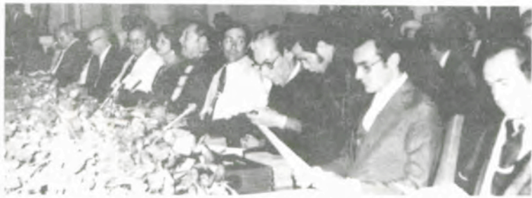
A mesa que dirigiu os trabalhos da sessão solene de encerramento das festividades do Cinquentenário da UFV.

As solenidades começaram com a recepção ao Governador Aureliano Chaves e comitiva, tendo o Chefe do Executivo mineiro inaugurado as obras de pavimentação e urbanização do «campus» e as obras de ampliação do Refeitório. Mais tarde, o Governador do Estado sancionou, na Reitoria, a Lei que dispõe sobre a subvenção anual para a Universidade.