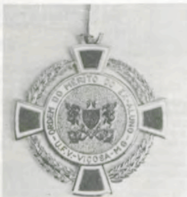
A medalha da Ordem do Mérito do Ex-aluno.

Para homenagear os seus ex-alunos que tenham prestado relevantes serviços à coletividade, em quaisquer das inúmeras áreas de atividades humanas, a Universidade Federal de Viçosa instituiu a Medalha da Ordem do Mérito do Ex-Aluno, que será conferida, anualmente, no dia 15 de dezembro.