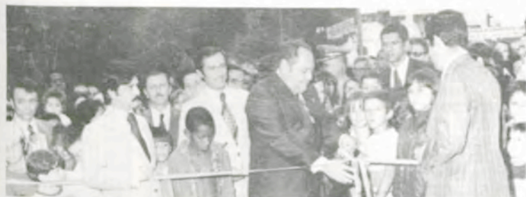
A inauguração das obras de pavimentação e urbanização do "campus" da UFV.