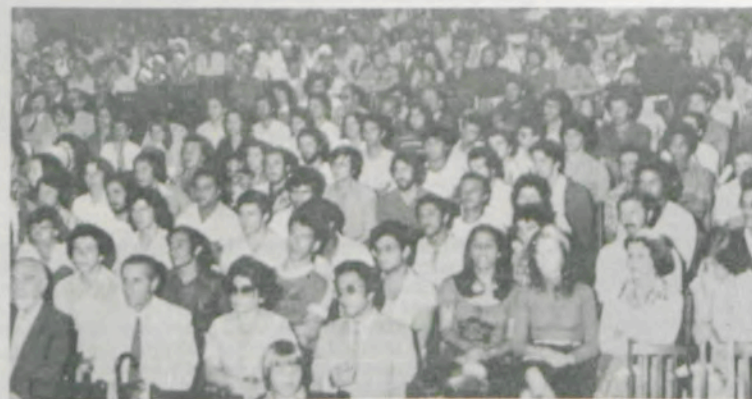
Professores, estudantes, funcionários e figuras representativas da comunidade viçosense participaram das comemorações do Cinquentenário da UFV.