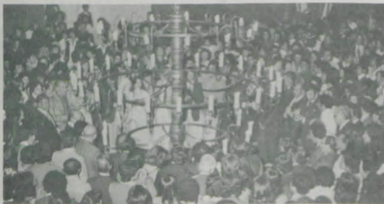
O Baile de Gala do Cinquentenário da UFV foi um dos grandes acontecimentos sociais de Viçosa.