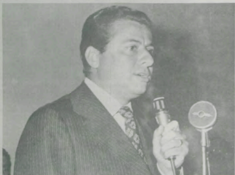
O ministro Alysso Paulinelli, da Agricultura, falou, ontem, sobre "Agricultura no Desenvolvimento Nacional".