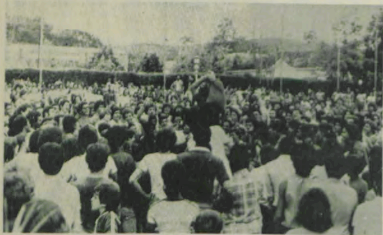
A luta do travesseiro provocou muito riso.