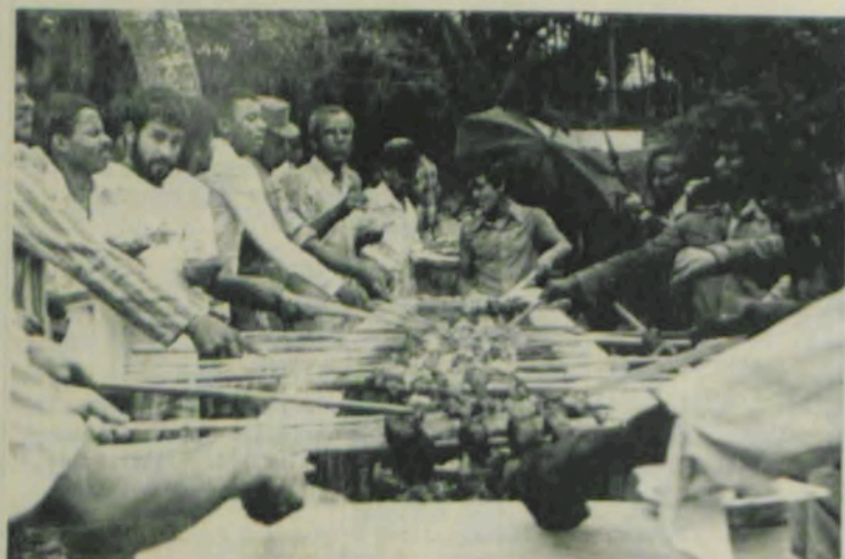
Um aspecto do churrasco oferecido aos operários da UFV.