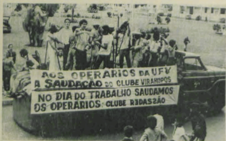
A saudação dos estudantes.