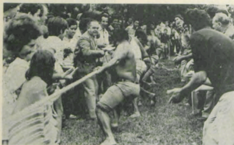
Operários e estudantes disputam o cabo de guerra.