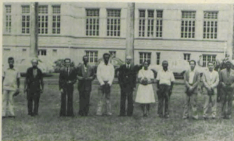
O reitor da UFV e os servidores mais antigos.