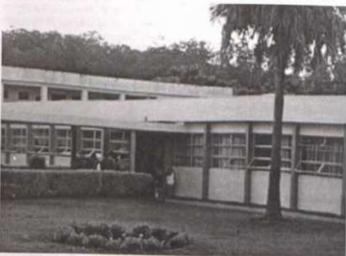
Prédio do CEE, um dos locais de atuação da PEC