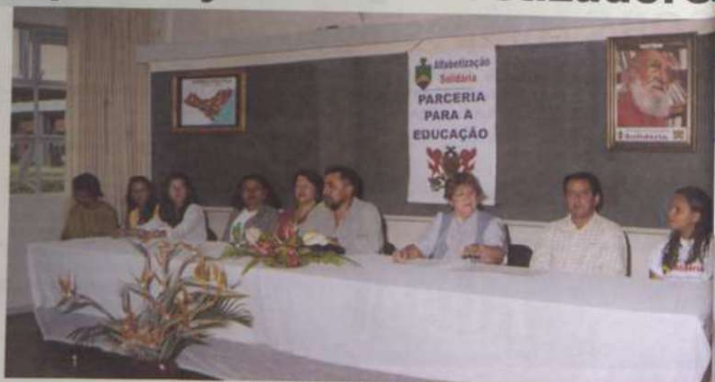
Autoridades que constituíram a mesa de abertura do curso

Nestes cinco anos, a UFV, alfabetizou 5.082 pessoas, sendo a maioria de trabalhadores do meio rural e seus fa-