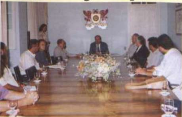
O protocolo de intenção foi assinado pelos representantes na Reitoria

Estiveram reunidos na UFV, no dia 15 deste mês, os representantes do executivo municipal das cidades de Astolfo Dutra, Barbacena, Cajuri, Coimbra, Dona Euzébia,