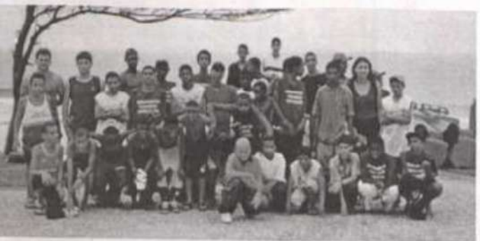
A equipe da Escolinha durante a excursão