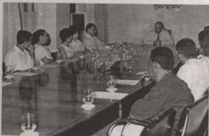
Aspecto da reunião na Reitoria

De acordo com o reitor, esses funcionários, mesmo aposentados, devem ser lembrados como servidores que foram e ainda continuam sendo úteis à Instituição, não podendo simplesmente passar na Diretoria de Recursos Humanos, assinar a documentação e se afastar da Universidade, dada a sua importância na reconstituição da história da UFV.