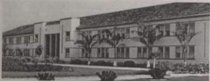
Edifício Principal da CEDAF

Terão início, às 17h do dia 6 de fevereiro, com o Plantio da Árvore dos Formandos, as solenidades de entrega dos certificados de fevereiro de 2002, da Central de Desenvolvimento Agrário de Florestal (CEDAF).