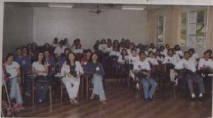
Alguns dos alfabetizadores que estão participando do curso

Mais informações sobre o Programa são obtidas no site www.ufv.br equipamentos ou com os membros comissão.