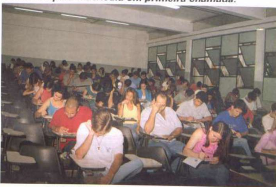
O Vestibular/2002, a exemplo dos anos anteriores, foi muito concorrido

6ª chamada: 20 de maio – Matrículas: 23 de maio (das 14 às 17h).