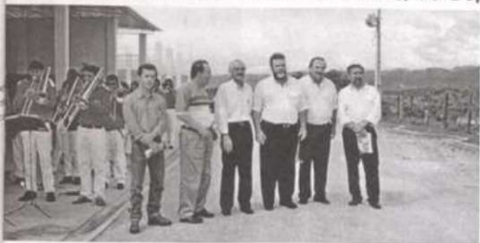
Autoridades e técnicos presentes à solenidade de inauguração