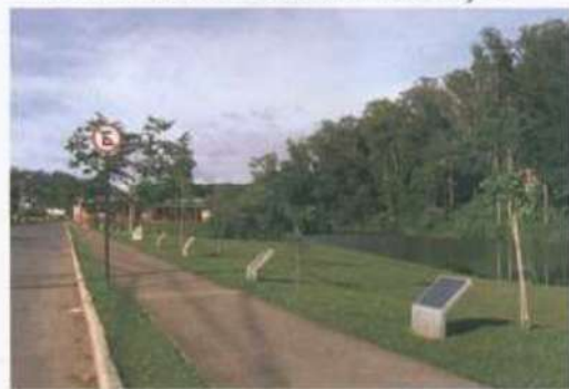
Árvores de turmas são plantadas há mais de 80 anos

Como acontece desde 1931, a turma de formandos de janeiro de 2012 também deixou a sua muda de árvore no campus da UFV. A escolhida desta vez foi o pau-brasil ( Caesalpinia echinata ). Plantada ao meio-dia de 20 de janeiro, atrás do Espaço Acadêmico-