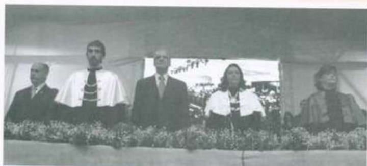
A mesa de honra da cerimônia recebeu diversas autoridades