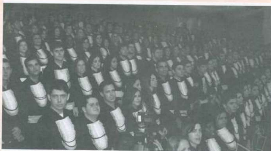
Formandos compartilham a emoção do momento

O Baile de Gala, com início às 23h, no Espaço Multiuso, marcará o encerramento das festividades. No palco, a banda Gang Lex, grupo Bartucada, DJ Moranguinho e MC Koringa.