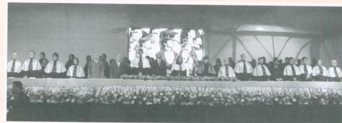
A colação de grau teve a participação de membros dos colegiados superiores da Universidade

Completaram a programação, nesta quinta-feira, a homenagem dos centros de ci-