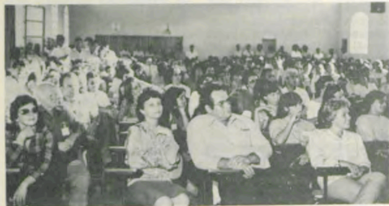
O plenário da sessão de abertura da Semana.