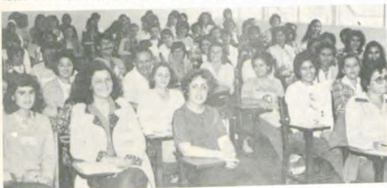
As participantes e os professores do Treinamento, durante uma das aulas.