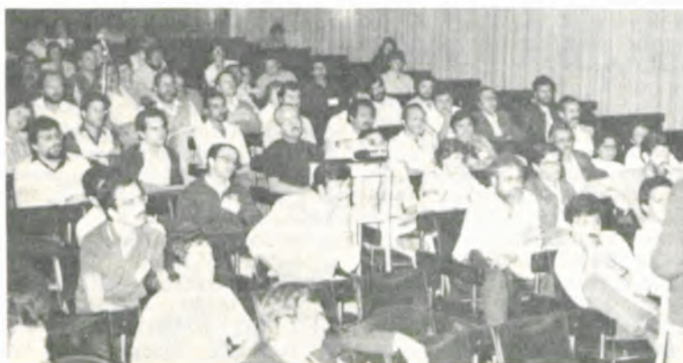
Parte do plenário durante a assembléia geral.