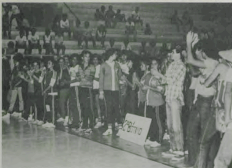
A turma vencedora do I TICO.