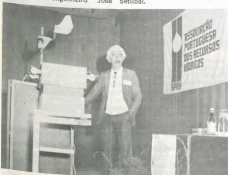
O representante da UFV, ao fazer sua palestra.

Foram visitadas também a Usina Hidrelétrica de Castelo do Bode, a maior de Portugal, reguladora do sistema Zêzere-Tejo. Ali, o representante da UFV discorreu, para os membros da administração do complexo, sobre o sistema energético brasileiro, principalmente o Programa Nacional de Pequenas Centrais Hidrelétricas, que despertou especial interesse nos técnicos portugueses. As visitas estenderam-se às estações de tratamento de água, para o atendimento de Lisboa, e de esgotos, na cidade de Setúbal.