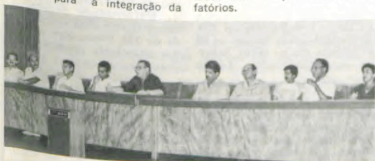
A mesa que dirigiu os trabalhos.

Criado através de um convênio entre a UFV, a Caixa Econômica do Estado de Minas Gerais e o Banco Central do Brasil, o Programa Gilberto Melo tem o objetivo de treinar o universitário. Este, absorvendo influências de uma realidade e confrontando-a com outra, constituirá um elo que tornará viável o apoio ao desenvolvimento regional. Esse apoio é uma ampliação natural das funções que o Programa adquiriu pela sua dinâmica na região, visto que cria condições para a concretização dos anseios comunitários e sua integração regional. Adequando o desenvolvimento do trabalho proposto às reais necessidades regionais, o Programa evita, em sua estrutura interna, a programação vertical tão amplamente utilizada no País e cujos resultados nem sempre foram satisfatórios.